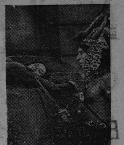
Una impresionante escena de "En la selva del terror", próxima jornada de "En la selva del terror"