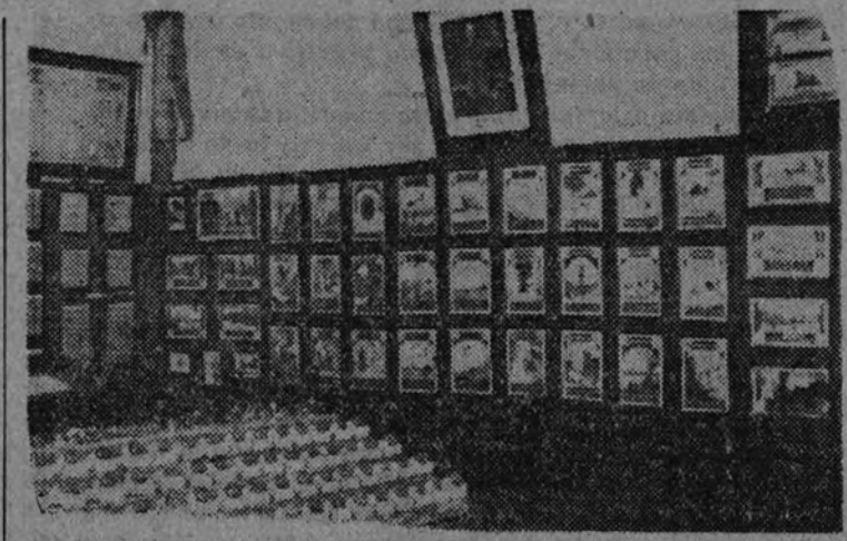
Aspecto de una de las salas de la Exposición del Sello, que actualmente se celebra en Madrid

Dados el carácter de funcionarios públicos que ha otorgado a los enlaces la disposición de la Presidencia de 3 del actual, les recordamos la obligación que tienen de acudir a estos actos electorales.