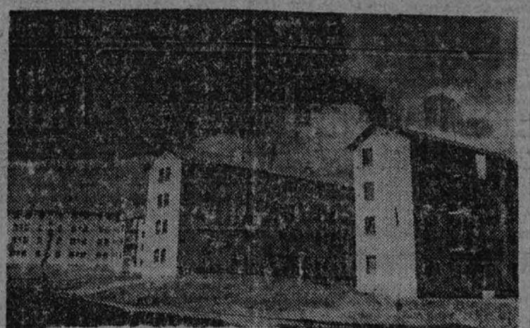
Vista del nuevo bloque de viviendas "General Moscardó"

El total de viviendas facilitadas y próximas a entregar por el Municipio es de 1.641. La Municipalidad matritense pechará con los gastos íntegros de las actividades constructivas del terreno, de la mano de obra y de