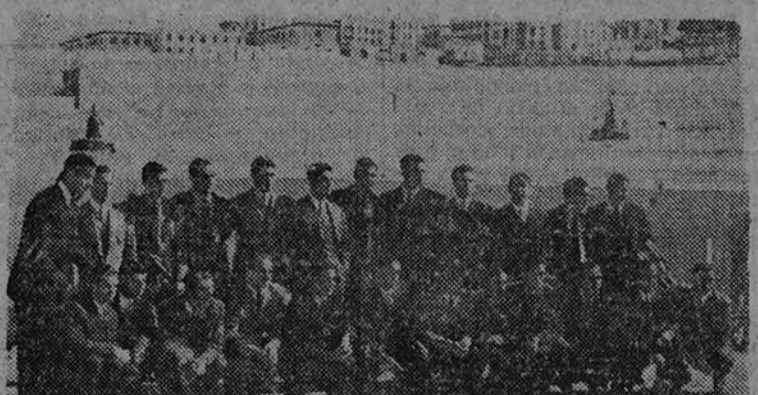
Los jugadores del Sporting Lisboa y los del Atlético Aviación confraternizan en el terreno donde hoy jugarán el encuentro

Tercera carrera.—Premio "Ayuntamiento de El Pardo"—8.500 pesetas.—2.000 metros.