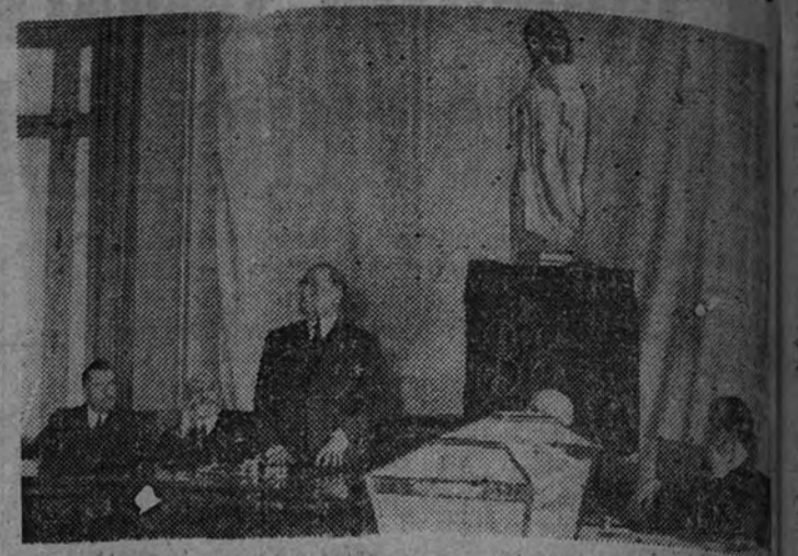
Acto de propaganda sindical para las elecciones en el Banco de España

Inarrugables, inescrutables, Corbata BEN HUE, Alcalá, 20