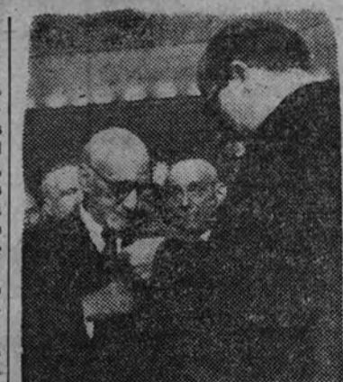
El Ministro de Educación Nacional impone la Cruz de Alfonso X el Sabio a don Jacinto Benavente

Hoy el Estado español, por voluntad de su Caudillo, premia la labor literaria de un escritor que supo cultivar con maestría íntima todos los géneros teatrales. Así, desde el estreno del «Nido ajeno», la tarde del 6 de octubre de 1894, pasando por «Los intereses creados», «El collar de las estrellas», «Campo de armijo», «Señora ama», «La ciudad alegre y confiada», «Gente conocida» o «Al natural», como comedias de estilo burgués, aristocrático, rural o moralizante hasta el teatro infantil y fantástico con «El príncipe que todo lo aprendió de los libros», el drama simbólico, el pasillo cómico, el monólogo y el sainete, don Jacinto Benavente no ha dejado sin cultivar ni una sola de las recatadas parcelas del vasto mundo de la literatura teatral. España quiere premiar al hombre que desde el año 1912 se sienta en los sillones de nuestras Academias, al que en 1922 recibió de la Academia sueca de las Ciencias el máximo galardón del Premio Nobel, y al que en medio siglo de trabajo, en fin, ha consagrado su pluma al noble oficio de las letras hasta conseguir, como si mismo soñaba, elevar el teatro español al más alto trono de la poesía y del arte.