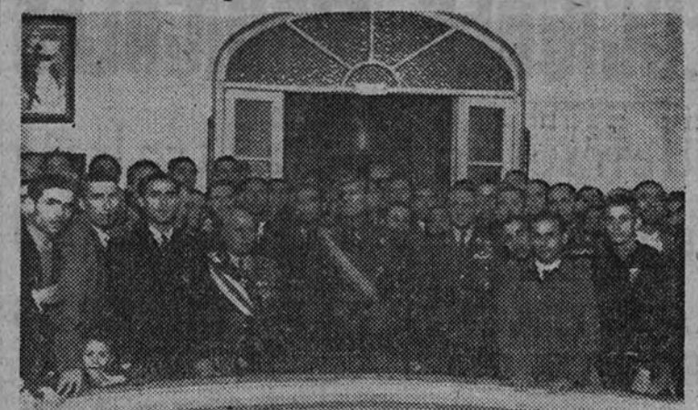
El general Millán Astray, rodeado de Caballeros Mutilados después de la misa celebrada en la Dirección General

Función en el Price, con asistencia de la esposa del Caudillo