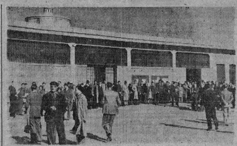
Productores del Sindicato de Frutos y Productos Hortícolas esperando turno para votar en el Mercado de Legazpi.

En la Vicesecretaría de Ordenación Social se reciben continuamente de toda España datos referentes a las elecciones sindicales, sobre los que se trabaja sin descanso para ultimar el escrutinio de las mismas. La impresión que alimos ayer sobre la votación en todas las ciudades y pueblos de España no iba ni con mucho desaminada, pues los datos más concretos que ya se van recibiendo ahora, remitidos por los Delegados Sindicales Provinciales correspondientes, vienen a confirmarla, y son prueba evidente de que se han rebasado en todas partes los cálculos más optimistas. El espíritu de disciplina y el entusiasmo de que han estado animados todos los productores españoles que han tomado parte en estas elecciones son la nota destacada de ellas. Aun cuando por un sinnúmero de causas fáciles de comprender, como son deficiencia de comunicaciones desde algunos puntos, acumulación de servicios en centrales de teléfonos, etc., no se tienen datos concretos de muchos pueblos, podemos repetir que el porcentaje de productores que han emitido sufragio se eleva a un 95 por 100 del censo. De Madrid queremos destacar que en Valdecasas ha votado el 100 por 100 de los productores, y que