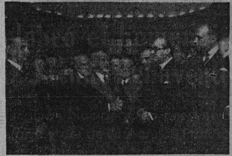
Benavente, durante su discurso.

Y ello es así, porque este acontecimiento encierra—para mí—el más alto valor simbólico. Significa, ante todo, que el Estado vive, bajo el estímulo de su Caudillo, en actitud constante de atención y desvelo por todas las manifestaciones de la cultura. Y a este Estado que ha sabido estimular ardientemente la investigación, que ha investido nuevo espíritu a la Universidad, que vela con cuidado exquisito por el desarrollo del arte en todas sus más variadas manifestaciones, no podía resultarle indiferente la admirable obra literaria que en cincuenta años de incansable producción ha dado al teatro español el genio y el talento insigne de don Jacinto Benavente. Quando aparecen por primera vez sobre los escenarios de España los primeros personajes de la farsa benaventina, nuestro teatro estaba necesitado de una inmediata renovación. De un mundo dramático en el que la acción y las pasiones se antepusieron a todo, el teatro adquirió, a través de don Jacinto Benavente, una incomparable dignidad literaria, por la que una prosa de empaque se levantó al diálogo de los personajes belleza de (Continúa en segunda página.)