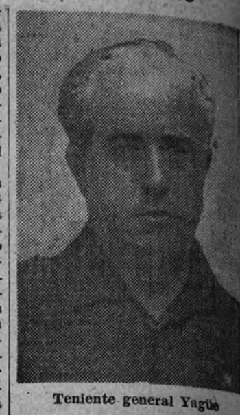
Teniente general Yagüe

Según los informes facilitados por el heroico soldado, el día 4 del corriente cruzaron la frontera francoespañola dos grupos de marxistas, uno por Valcarlos y otro por el valle del Roncal, con un total de ochocientos hombres, perfectamente armados y organizados en unidades tácticas. Estos grupos habían sido concentrados en Toulouse y San Juan de Piedra-Port. Pretendían correrse a Asturias y organizar guerrillas por todas partes, pues se les había hecho creer que el país entero iba a sumarse y que su presencia