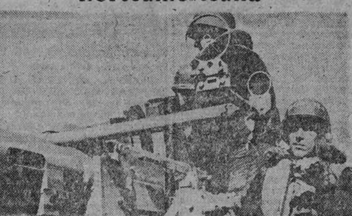
Miembros de una batería a bordo de una barcaza de desembarco norteamericana hacen prácticas de tiro en unas maniobras.