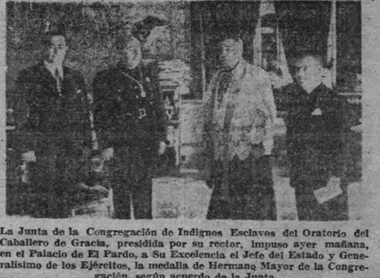
La Junta de la Congregación de Indígenas Esclavos del Oratorio del Caballero de Gracia, presidida por su rector, impuso ayer mañana, en el Palacio de El Pardo, a Su Excelencia el Jefe del Estado y Generalísimo de los Ejércitos, la medalla de Hermano Mayor de la Congregación, según acuerdo de la Junta

Ayer, en El Pardo, le fueron impuestas las insignias por el rector del oratorio