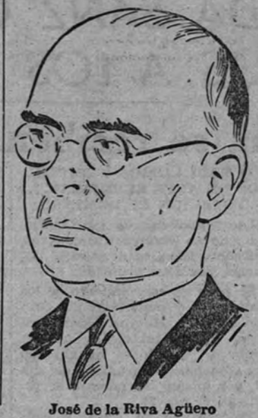
José de la Riva Agüero

Pertenecía a la Real Academia Española y a la de la Historia