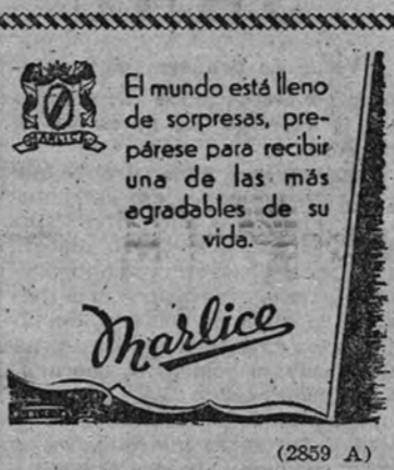
El mundo está lleno de sorpresas, prepárese para recibir una de las más agradables de su vida.

VENECIA 26. (I. R.). — La ciudad diplomática que el Gobierno republicano fascista habilitó para los representantes acreditados de las naciones amigas se ha trasladado desde Venecia a las orillas del lago de Como. Exceptuando los daneses, que se han quedado en el Lido, y los representantes búlgaros, todos los diplomáticos han seguido este "éxodo hacia el Norte".