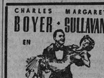
Charles Boyer y Margaret Sullivan encabezan el reparto de «Cita de amor», comedia que será presentada al público por Universal Films