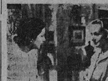
Kay Francis y Carlo Lombard, las dos primeras figuras femeninas de «Dos mujeres y un amor», en una escena de esta película