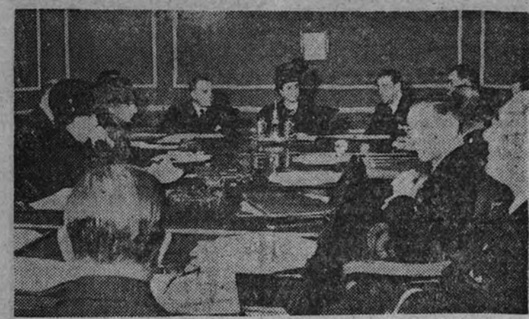
La esposa del Jefe del Estado, en unión del Ministro de Justicia, en la presidencia de la sesión extraordinaria del Patronato de Protección a la Mujer.

Ayer tarde se reunió la Junta Nacional del Patronato de Protección a la Mujer, bajo la presidencia de su presidenta honoraria, la excelentísima señora doña Carmen Polo de Franco, y del presidente efectivo, excelentísimo señor Ministro de Justicia, don Eduardo Aunós.