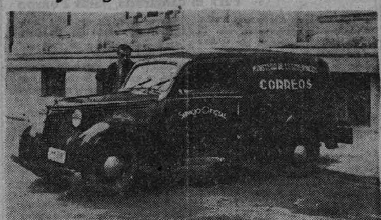
Uno de los nuevos coches del Parque Móvil de los Ministerios Civiles, que desde ayer hacen el servicio de recogida y distribución de la correspondencia desde la central a las estaciones de distrito, estaciones y aeródromo de Barajas.

Ya funcionan en Madrid 37 nuevos coches y furgonetas del P. M. M. C.