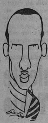
Cayetano Luca de Tena

Para celebrar el centenario del "Tenorio", la dirección del teatro Español ha querido dar este año caracteres de gran acoñecimiento a la realización de la inimitable obra de don José Zorrilla. A este efecto, Cayetano Luca de Tena ha logrado una de las realizaciones más brillantes de su historia de director artístico del primer teatro de España, logrando una maravillosa creación de la plástica escenográfica del "Tenorio", no solamente recurriendo a decorados corpóreos en su momento, a síntesis de la más fina belleza, en otros lugares, a verdaderos alardes de luminotécnica, jugados en la escena a gusto preciso, y con el mejor tiempo, sino que también ha logrado una versión certísima de los personajes de esta obra, de modo que cada uno de ellos, tanto en lo que se refiere a la pura ficción y a la fantasía del poeta creador, sino también a la realización exactísima de los movimientos, humanamente logrados en lo que se refiere a lances, pasión, ironía, desenfado, todo logrado de la manera más original y justa.