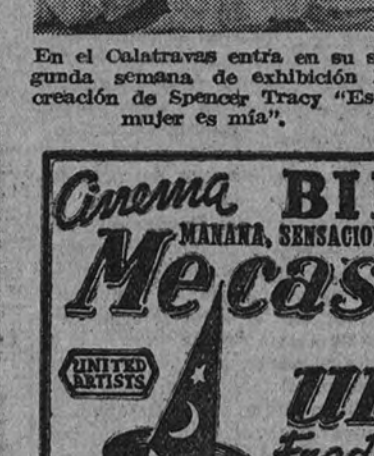
Fredric March y Verónica Lake, pareja central de la fantástica y morriónica "Me casé con una bruja", cuyo reestreno anuncia el Bilbao