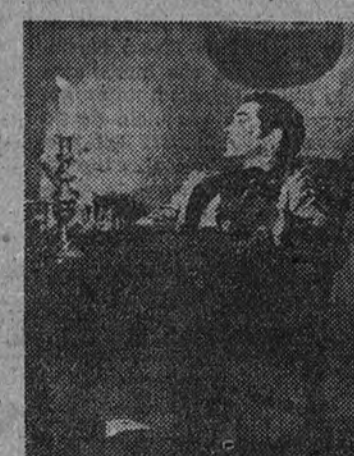
Fredric March y Verónica Lake, pareja central de la fantástica y morriónica "Me casé con una bruja", cuyo reestreno anuncia el Bilbao