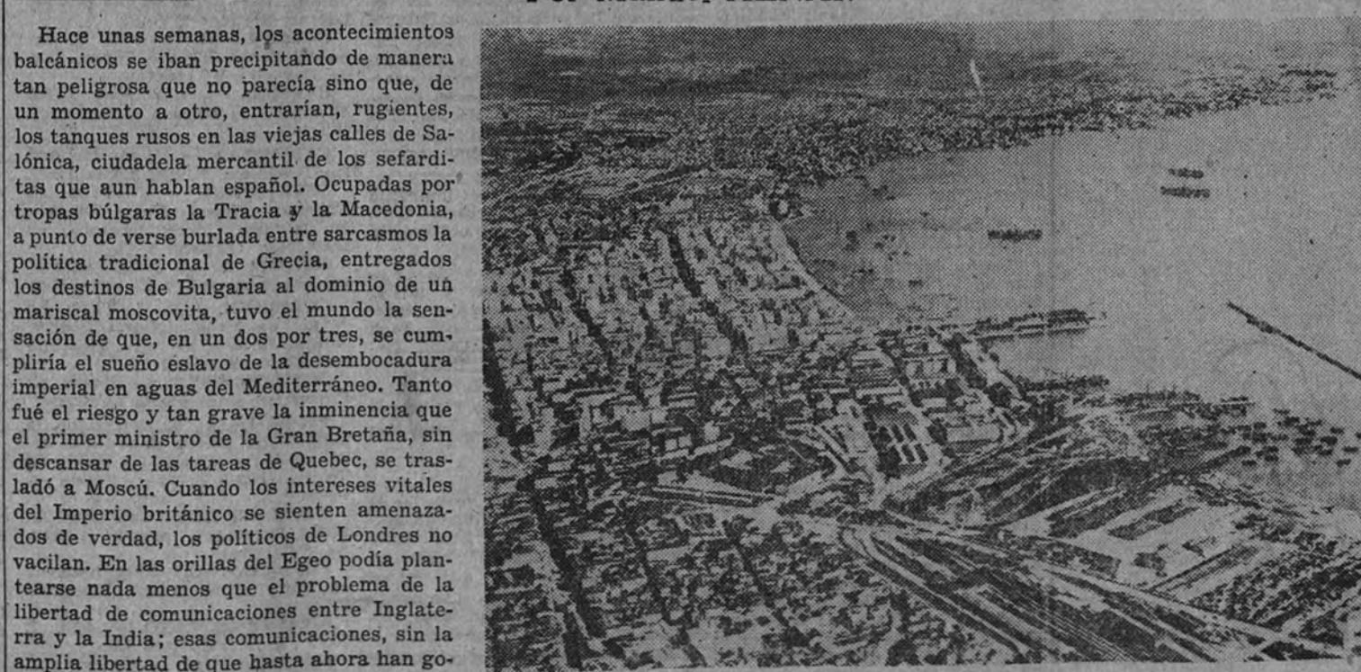
Vista del puerto de Salónica