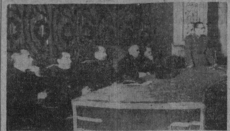
La presidencia del acto

El rector de la Universidad, el Vicesecretario de Secciones y el Jefe Nacional del S. E. U., presidieron el acto