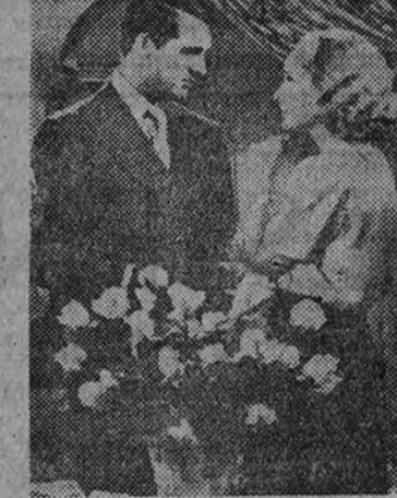
Tyrone Power, galán de "El signo del Zorro", en una escena de esta cinta, auténtico éxito del cine Callao.

a través de la magnífica técnica del recitativo que lleva esta producción. El Palacio de la Prensa demuestra con este su último grandioso éxito que sigue siendo la sala que exhibe las películas de máxima categoría, en un alarde inapreciable de programación, que el inteligente público sabe valorar justamente al llenar constantemente su suntuoso local.