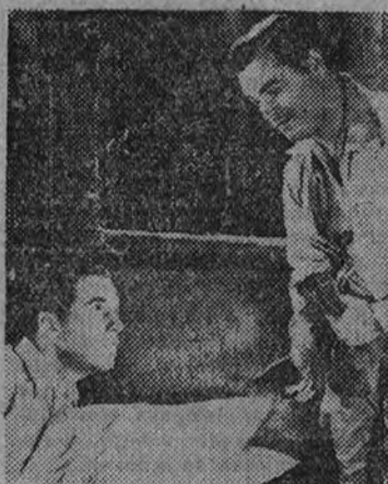
"La clostriz delator" es el título de la segunda jornada de "En la selva del terror", que mañana se estrena en el Cinema Palace Hotel

"Dos mujeres y un amor" nos van a dar a conocer un Cary Grant nuevo, tratando un nuevo problema humano: el amor y el dinero en el matrimonio. Cary Grant, casado y divorciado con la mujer más rica del mundo (Barbara Hutton), es quizás uno de los pocos hombres capacitados para tratar de es-