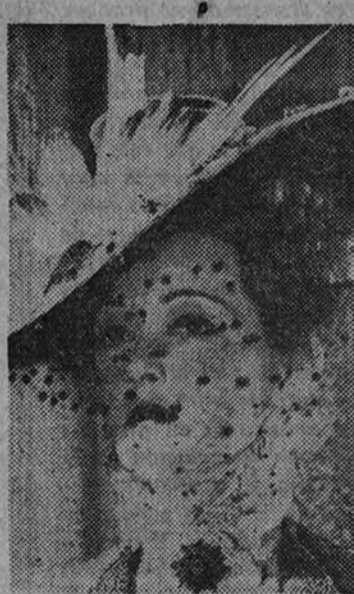
Bette Davis, primera figura de "La loba", película que proyectará el cine Bellas Artes