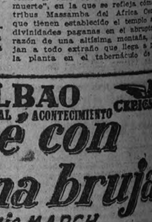
Fredric March y Verónica Lake, pareja central de la fantástica y morriónica "Me casé con una bruja", cuyo reestreno anuncia el Bilbao