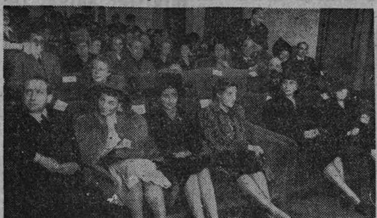
La esposa y la hija del Caudillo, con la esposa del Ministro Secretario General del Movimiento, el Vicepresidente de Secciones, la Delegada Nacional de la Sección Femenina y otras personalidades, durante el concierto a que asistieron ayer en el Círculo "Medina".

Estuvieron acompañadas por la esposa del Ministro Secretario del Movimiento y otras personalidades