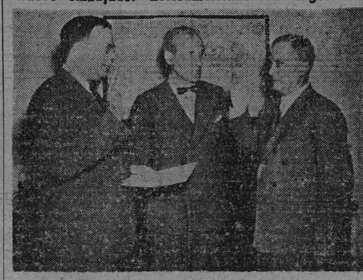
Richard C. Patterson, nuevo embajador de los Estados Unidos en Yugoslavia, presta juramento de su cargo en el departamento de Estado de Washington