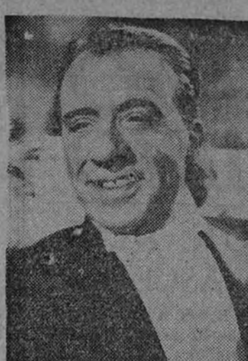
El gran actor cómico Miguel Ligero vuelve a la pantalla como protagonista de "El rey de las finanzas", una divertida comedia que será presentada por Chamartín