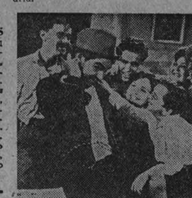
Charles Boyer y Margaret Sullivan en un momento de "Cita de amor", que en segunda semana se exhibe en el Capitol

Sobre este punto sólo nos resta repetir que los trabajos han de enviarse a "Faro, S. A.", General Mola, 97 (Concurso Biografías Ines de Castro), Madrid.