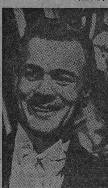
El galán Joseph Cotten en un primer plano de la superproducción "El cuarto mandamiento", cuyo estreno constituirá uno de los mayores acontecimientos de la actual temporada