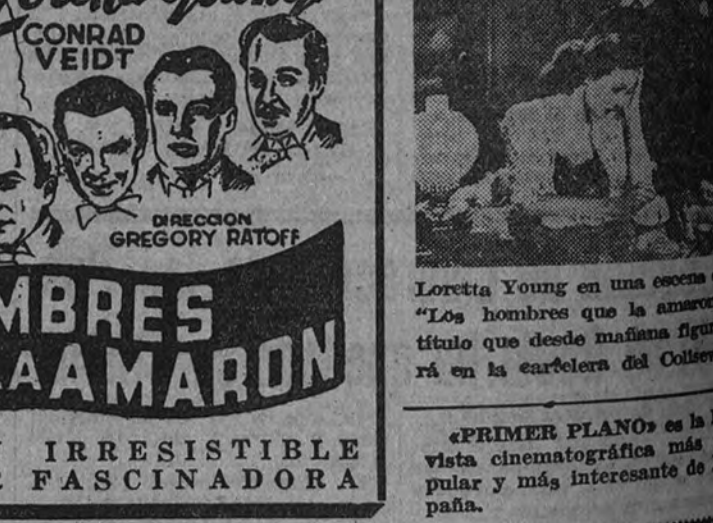
Loretta Young en una escena de "Los hombres que la amaron", título que desde mañana se exhibirá en la cartelera del Coliseum

Orson Welles EL MASO DE UNA NUEVA TECNICA