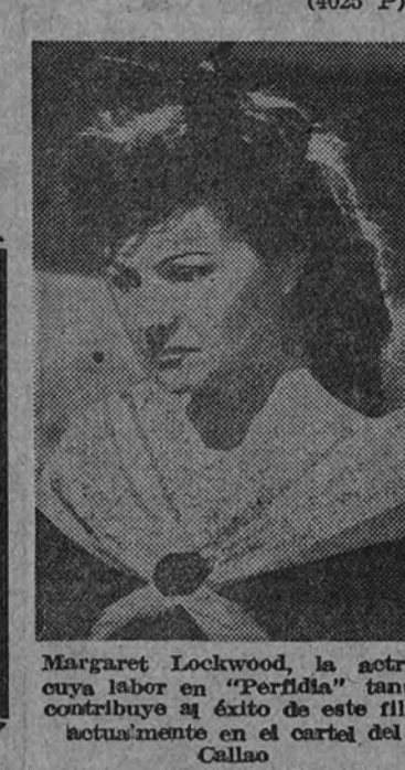
Margaret Lockwood, la actriz cuya labor en "Perfidia" tanto contribuye al éxito de este film actual, en el cartel de Callao