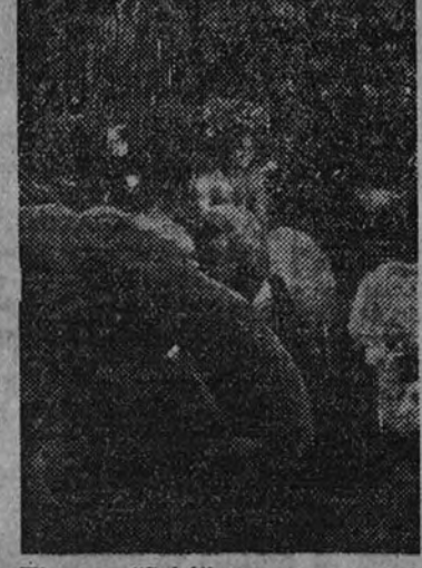
El actor "Sabi" en una escena de "El libro de la selva", producción en technicolor que se exhibe en segunda semana en el Progreso