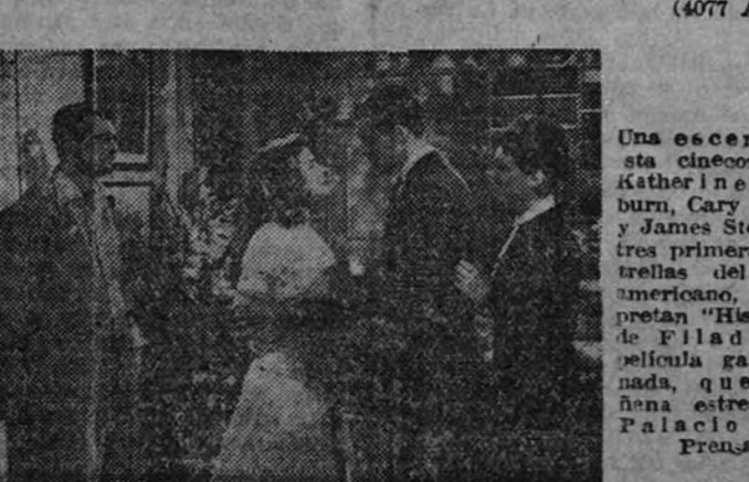
Una escena de esta cinecomedia Katherine Hepburn, Cary Grant y James Stewart, tres primeras estrellas del cine americano, interpretan "Historias de Filadelfia", película galardonada, que mañana se exhibe en el Palacio de la Prensa