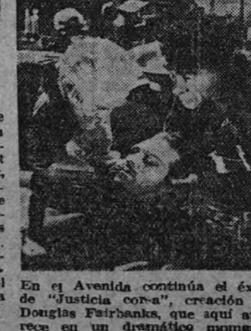
En el Avenida continúa el éxito de "Justicia corsa", creación de Douglas Fairbanks, que aquí aparece en un dramático momento del film