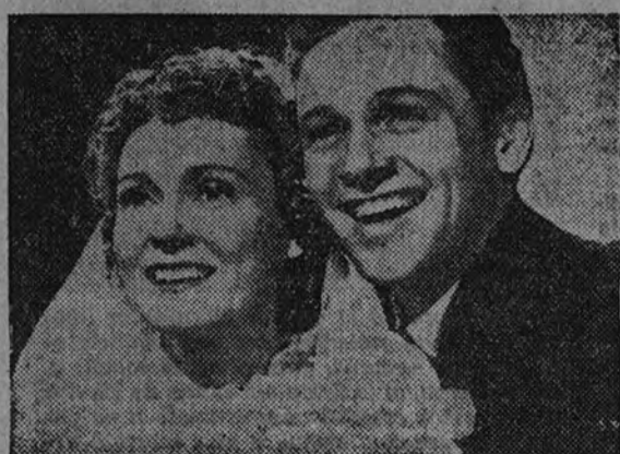
Martha Scott y William Holden, la pareja feliz de "Sinfonía de la vida", un film desconcertante por su sencillez originalidad, realización de Sam Wood, que Cericsa presenta mañana en el Imperial