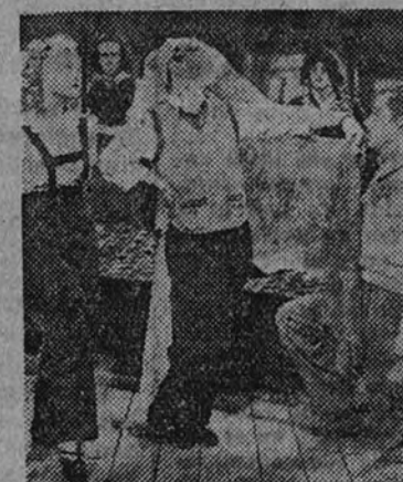
Mickey Rooney en una escena cómica de "Hijos de la farándula", del programa que para mañana anuncia el Callao