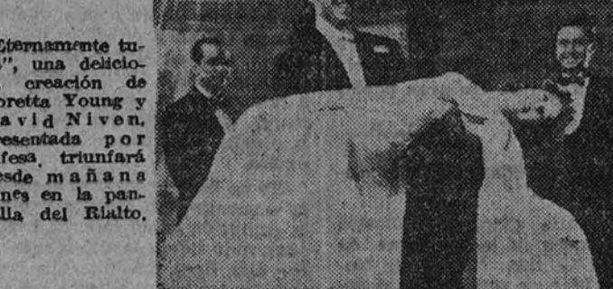
"Eternamente tuya", una deliciosa creación de Loretta Young y David Niven, presentada por Cifesa, triunfará desde mañana lunes en la pantalla del Rialto.