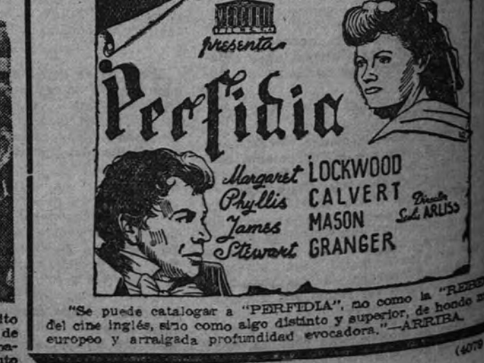
"Se puede catalogar a "PERFIDIA", no como la "REPERDIA" del cine inglés, sino como algo distinto y superior, de honda inspiración europea y arraigada profundidad evocadora." -ARRIBA

2.ª SEMANA DE FORMIDABLE ÉXITO DE LA SENSACIONAL SUPERPRODUCCIÓN