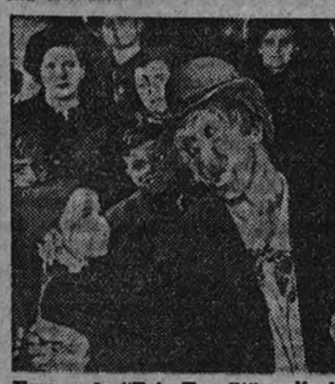
Escena de "Trío Tonelli", película de ambiente cómico que Cifesa presenta mañana en el Palacio del Cine

En "El libro de la selva", la materia fotográfica ha llegado a un punto de evolución tan considerable, a un grado tal de perfección que ya es inconfundible con la materia de otras artes. Y se infunde, en el cine, poder hallar un lenguaje capaz de todo el empuje de toda la gran materia que parecían reclamar. En "El libro de la selva" encontramos la imagen perfecta, el ritmo armónico, el sentido de una clara depuración en nuestra espiritualidad la caricia de la emoción inolvidable.