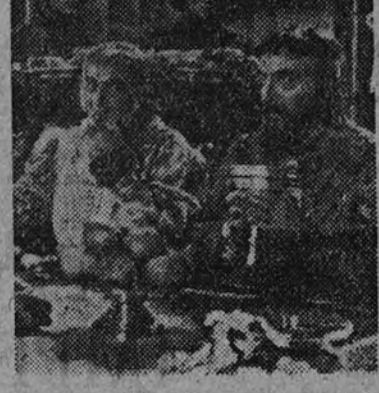
Fotograma de "Inés de Castro", film histórico editado por Faro Films

Esta clase de reparto, según George Cukor, director del film mencionado, facilita el trabajo de tal manera, que diri-