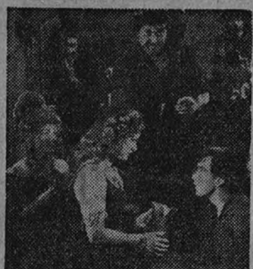
Maureen O'Hara y Edmon O'Brien desempeñan los principales papeles en "Esmeralda la zingara", superproducción que será presentada por Astoria

"JUSTICIA CORSA" Douglas Fairbanks (Hijo), una de las personalidades más prodigiosas de la pantalla, vuelve ahora a ella con una producción que será la admiración del mundo: "Justicia corsa", una novela apasionante, en la que desfilan la lucha secular entre dos poderosas familias corsas, Douglas Fairbanks (Hijo) interpreta a