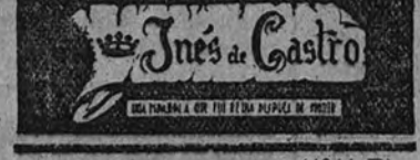
"Inés de Castro", film histórico editado por Faro Films

Sam Wood presenta algo extraordinario, realizado todo dentro de la mayor sencillez. Esta película, que nos ofrece Copicsa, puede calificarse de desconcertante y genial, y viene ya precedida de éxitos apoteósicos en Norteamérica e Inglaterra.