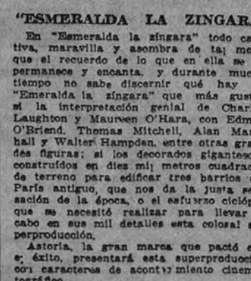
"ESMERALDA LA ZINGARA"