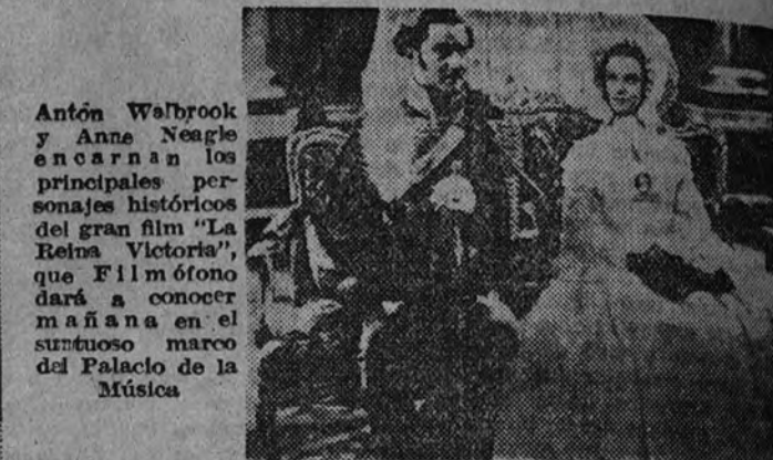
Antón Walbrook y Anne Neagle encarnan los principales personajes históricos del gran film "La Reina Victoria", que Filmofono dará a conocer mañana en el suntuoso marco del Palacio de la Música