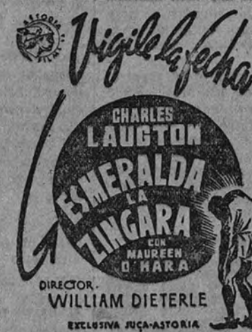
Charles Laughton en una escena de "Esmeralda la zingara", película que mañana se exhibe en el Callao