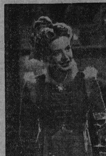
La actriz Phyllis Calvert en un fotograma de "Perfidia", el apasionante cine drama que triunfa en la pantalla del Callao