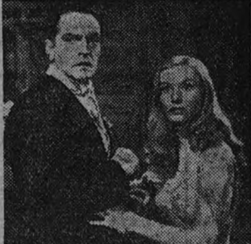
"Me casé con una bruja" entra en su tercera semana de exhibición en el Bilbao. He aquí una escena de este film humorístico