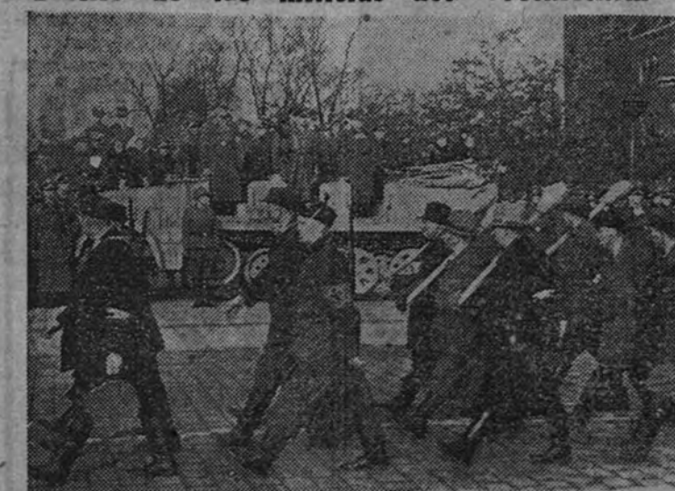
El jefe de las S. S., Himmler, y el jefe del Estado Mayor, general Guderian, presiden el desfile de los batallones del Ejército del pueblo alemán (Foto Transatlántico-Orbis).

(FRANCO.—Declaraciones a "United Press".)