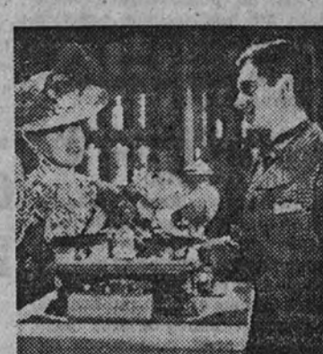
Mary Delgado y Antonio Casal, en un diálogo de la producción Cifesa "El clavo y don Juanita"