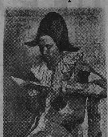
Uno de los cuadros de Tauler que figurará en la Exposición que, con obras de Serny y Morales, será abierta al público dentro de breves días