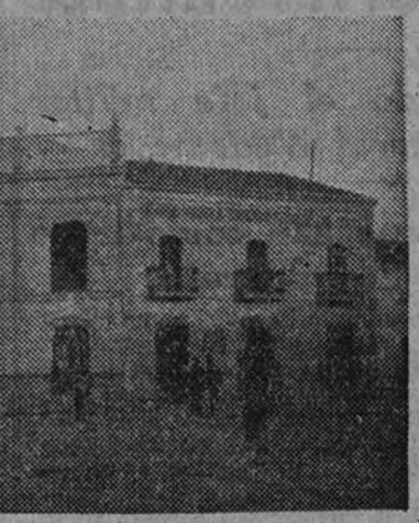
Cuartel de Falange.

La distribución de semillas, previamente seleccionadas, y de hierros para la labranza, es también de la competencia de esta entidad. La preside el Jefe de la