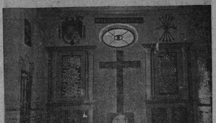
Muro de los Caídos, en el salón del cuartel de Falange.

Bajo la expresada razón social gira actualmente otra fábrica de curtidos, por procedimientos antiguos, pero de gran rendimiento, que ha conseguido imponerse en el mercado por la inmejorable