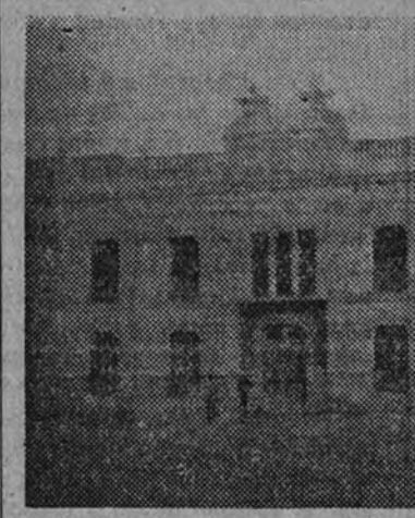
Fachada del nuevo Ayuntamiento. Al lado, el cuartel de Falange.

Pueblo de la Serena que, como toda la Serena, hasta el único grano de tierra de sus confines dispone de hombres capaces, honrados, libres de toda ligadura espiritual que pudiera conducirlos a la torpeza o a la claudicación; hombres forjados en la dura manigua del agro extremeño, en el que el pesado azadón que empuña experto y silencioso el rudo bracero sólo hallará descanso en su continuo trajín cotidiano cuando el toque del Angelus le levanta el corazón y le inspira el deseo emocional de clavar la rodilla en la tierra que le da generosa el pan bendito.