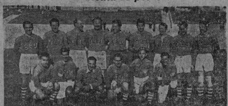
El equipo de Derecho, que el domingo dió la sorpresa al vencer por 5-3 a Medicina A, en el torneo de clasificación universitario

Derecho dió la sorpresa al vencer a Medicina A por 5-3