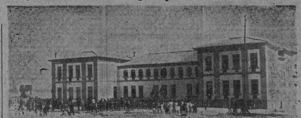
Vista de uno de los nuevos grupos escolares construidos

Y acuden en tropel a nuestra memoria las jornadas de júbilo popular vividas en Villaviciosa de Odón: magníficas Escuelas que funcionarán a la sombra de los gloriosos nombres de García Noblejas, Valdemorales, cuyas aulas nada tienen que envidiar a las del mejor Grupo Escolar de Madrid; Orusco, con espléndido edificio, y en cuyo lugar nos cupo el honor de poner la primera piedra de la casa para los maestros, del que recordamos como nota emotiva las lágrimas de su veterano maestro al contemplar la nueva Escuela; Campamento, cuyo edificio es ornato del