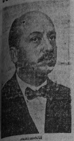
Marinetti. — Sección comunicada de la casa de la cultura futurista.

N. de la R.—El 22 de diciembre de 1930 nació Felipe Tomás Marinetti, en Alejandría (Egipto). Su juventud ha sido relatada por él mismo de la siguiente manera: «Crecí en París. Diecisiete años. En las "grises" del barrio latino y todas las agitaciones estudiantiles. Un último examen de Matemáticas y una triunfal de Física sobre las teorías de Stuart Mill. Llegué a Milán, "bachelier ès lettres", con una cultura francesa, pero invenciblemente italiano, a despecho de todos los ensayos de la Universidad de Turín. Mi tesis doctoral, "Les vieux marins", fue defendida por Sarah Bernhardt en su gran teatro».