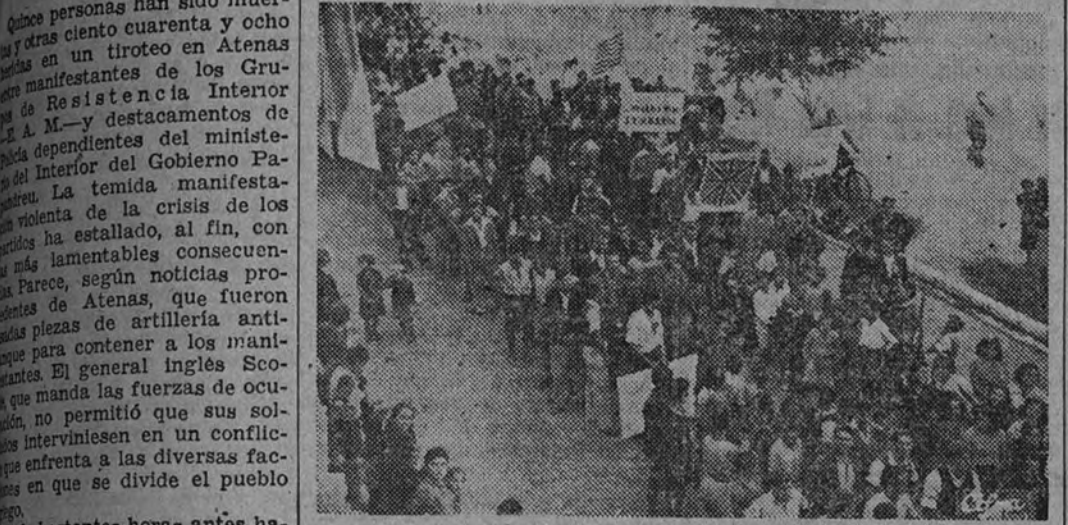
Las organizaciones izquierdistas y de la Resistencia griega se han manifestado contra el Gobierno Papandreu, produciéndose colisiones entre los manifestantes y las fuerzas de Policía. Nuestra foto representa una de las manifestaciones que han recorrido las calles de Atenas

Fuerzas británicas desarman a grupos de partisanos y vigilan las calles de Atenas y el Pireo