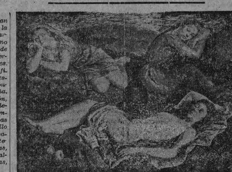
«Aguirre», por J. M. Aguirre

Este grupo de artistas presta un singular realce al certamen; pero aparte del interés intrínseco de sus creaciones, la Exposición ofrece la oportunidad de seguir con relativa puntualidad las direcciones actuales del arte en Cataluña, ya que la mayor parte de los artistas locales están presentes en ella. Al menos, la inquietud estética queda bien patente en la obra de los artistas de más talento, a los que sigue hoy una plé-