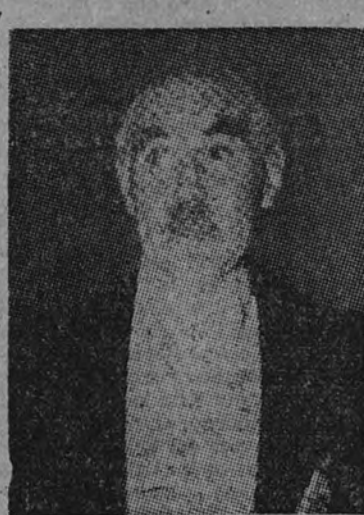
Joseph C. Grew