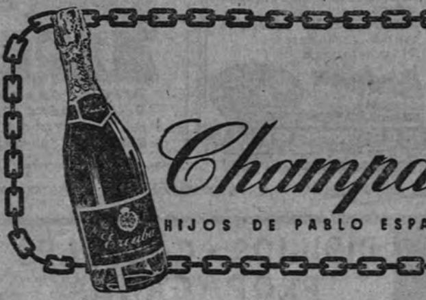
HIJOS DE PABLO ESPARZA • BODEGAS NAVARRAS S.A. • VILLAVA • NAVARRA

Por el contrario, otros pintores, como Pruna, se mantienen fieles a ciertas estilísticas modernas, con grave riesgo para el sentido permanente de la obra, o se entregan, algo rezagados, al decorativismo ganguiniano. El propósito de integrar las aportaciones del impresionismo y de la pintura más moderna a una concepción plástica de grandes