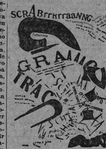
Página de un libro de Marinetti

«Italia, soberana absoluta. — La palabra «Italia» ha de dominar a la palabra «libertad». — Todas las libertades, menos la de ser bellicosos, pacifistas y antitalianos. — Una Flota potente y un Ejército potente, un pueblo orgulloso de estar dispuesto para la guerra, única higiene del mundo, y para la grandeza de una Italia agrícola, industrial y comercial. — Defensa económica y educación patriótica del proletariado. — Política exterior clásica, astuta y agresiva. — Expansión colonial. — Irredentismo. — Panitalianismo. — Anticlericalismo y antisocialismo. Culto del progreso y de la velocidad, del deporte, de la fuerza física, del valor temerario, del heroísmo y del peligro».