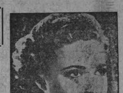
Loraine Day desempeña el principal papel femenino en el film "Enviado especial", éxito del Palacio de la Música

Maestranza Aérea de Madrid ANUNCIO Se admiten ofertas hasta el día 9 del corriente mes para la adquisición de DIVERSAS INSTALACIONES PARA UN TALLER GALVANICO. Condiciones técnicas y económicas a disposición de los oferentes en esta Oficina. Atencio, a cargo adjudicatario. Cuatro Vientos, 1.º de diciembre de 1944. El Secretario de la Junta Económica.