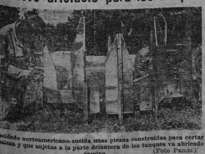
Un soldado norteamericano sujeta unas piezas construidas para cortar la malla y que sujetan a la parte delantera de los tanques ya abriendo camino