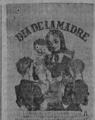
Cartel editado por el Frente de Juventudes con ocasión de la próxima festividad del «Día de la Madre»