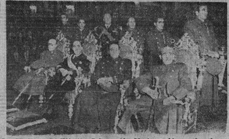
Los Ministros del Ejército, Gobernación, Marina y Aire, en la solemnidad religiosa celebrada en la iglesia de San Francisco el Grande

El Arma de Infantería organizó en todas las guarniciones actos religiosos y militares El Frente de Juventudes conmemoró con diversos actos el Día de la Madre Los Ministros del Ejército, Marina, Aire y de la Gobernación presidieron la solemnidad religiosa en San Francisco el Grande