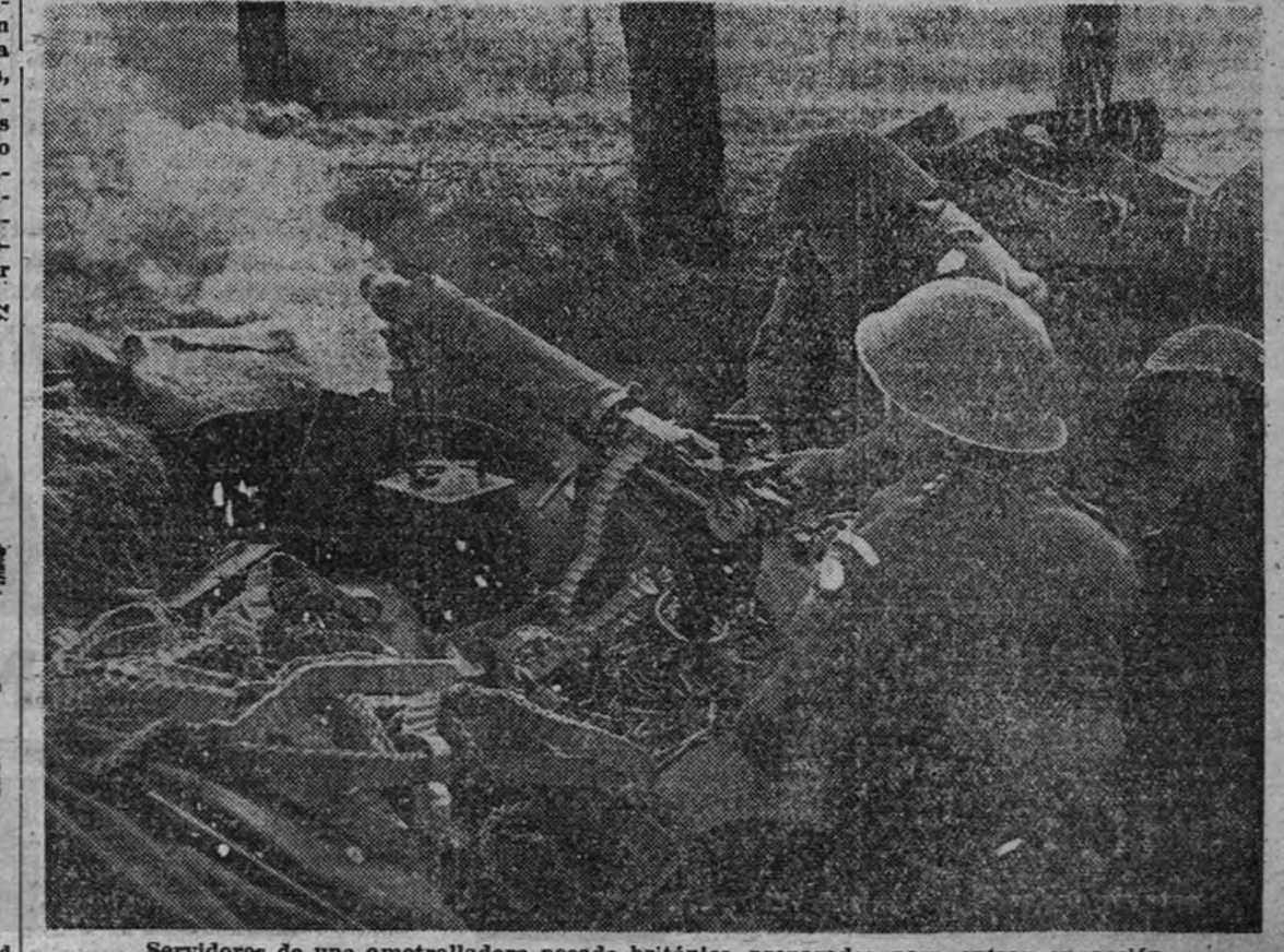
Servidores de una ametralladora pesada británica preparados para entrar en acción