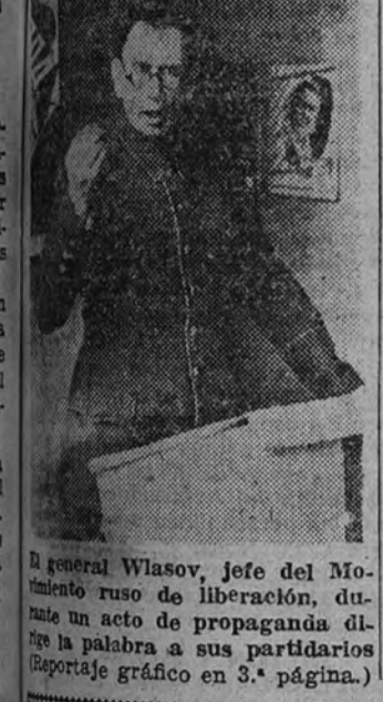
El general Vlasov, jefe del Movimiento ruso de liberación, durante un acto de propaganda dirigido a sus partidarios.