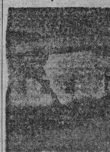
Escuela-capilla rural de Puente de la Sierra

El vasto plan de obras realizadas, a las que hay que agregar la creación del Cuerpo de Policía Rural, con cuarenta guardias para la prestación de ese servicio, no ha sido obstáculo para que el Ayuntamiento haya atendido a sus empleados y obreros en las circunstancias presentes, y así, además de haberles duplicado los sueldos,