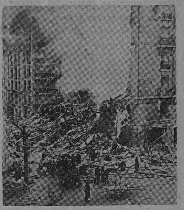
Una sola bomba pesada de las empleadas en la actual guerra basta para reducir a escombros una moderna edificación

Se ha notado, con suma gravedad la escasez de la vivienda; pero esa carencia—se agudiza más ante