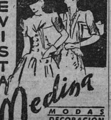
Administración: Corrientes, 14, Madrid