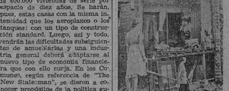
Entre las destruidas paredes continúa la vida de la población civil

El 12 de octubre, Fiesta de la Raza, el general Edelmiro Farrell, Presidente de la nación argentina, inauguraba en Buenos Aires los actos del Congreso Eucarístico Nacional, celebrado en conmemoración del décimo aniversario del internacional, que tuvo lugar en la misma capital argentina con la presencia del entonces cardinal Pacelli. A los actos celebrados en la espléndida Avenida del 9 de Julio asistieron millares de fieles, entre los que se contaban nutridas peregrinaciones, llegadas de todos los países limítrofes. En el acto inaugural, el general Farrell, junto con el venerable figura del cardinal Copello, fué objeto de indescriptibles muestras de entusiasmo de la multitud. Con este motivo el periódico «El Caballero» escribía que «el más grande acontecimiento de la historia de la Humanidad después del advenimiento del Cristianismo fué el del descubrimiento, la conquista y colonización del Nuevo Mundo por obra del pueblo español. España, con vitalidad combativa, audaz y poderosa, re-