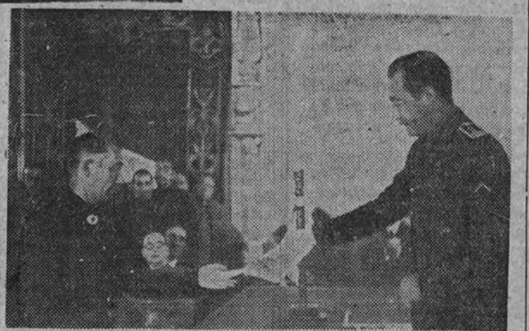
El Ministro de Agricultura entrega los diplomas a los agricultores en el Congreso Agrícola de Galicia, celebrado en Santiago

El ganadero gallego recibió en Santiago orientaciones justas, se le aclararon sus ideas y sabe que se lección a su ganado se trata de seleccionar a su ganado, por ahora, utilizar los cruzamientos industriales con Simmental hasta poder tener una raza pura con las dos modalidades de leche-trabajo y trabajo-carne.