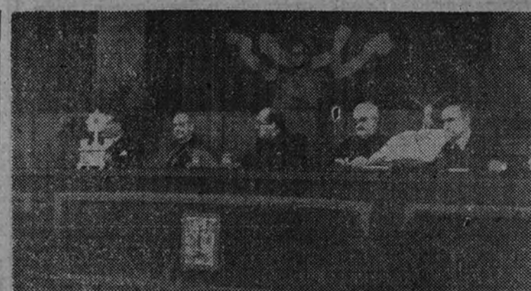
La mesa presidencial del solemne acto

LONDRES 14.—El embajador de Bélgica, barón de Cartier de Marchienne, ha inaugurado en las Galerías Milon, de esta capital, una Exposición de cuadros de los maestros de la escuela flamenga, varios de ellos prestados al efecto por relevantes personalidades, entre ellas el embajador de España. Los ingresos de la Exposición se destinan al fondo de ayuda a los niños y mujeres de Bélgica. (Efe.)