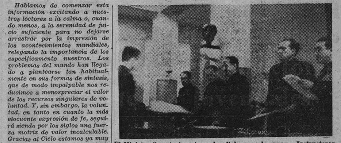
El Ministro Secretario entrega los diplomas a los nuevos instructores

El camarada Arrese explicó la última lección del curso y entregó los despachos