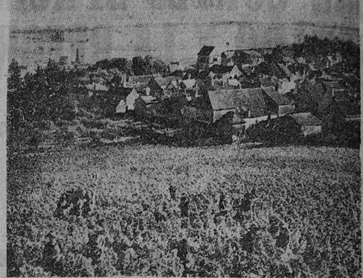
La recolección en un viñedo de la Champagne (Francia)

El champán es la bebida imprescindible para todo brindis de categoría y para la celebración de todo acto importante de la vida privada y oficial. Toda boda, bautizo o comida de calidad han de ser rociados con champán. Y como