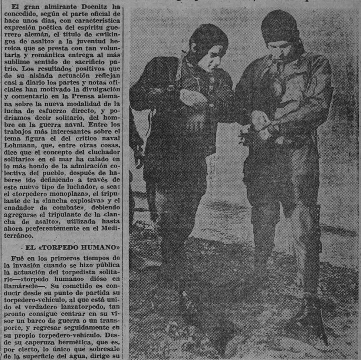
Nadadores de combate

El más heroico espíritu de entrega y sacrificio, servido por atletas