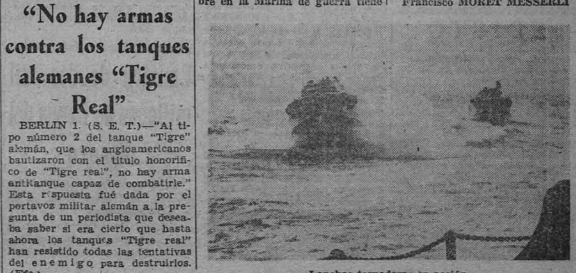
Lanchas torpederas en acción

Aunque el antiguo espíritu guerrero vikingo no haya desaparecido con la supresión del hacha y del cuchillo de abordaje, con la obligada acción directa del hombre aislado en su actuación decisiva en las batallas navales, bajo las distintas condiciones en que se desarrolla actualmente la guerra en el mar, con la intervención de cruceros auxiliares y submarinos, siendo buena prueba de ello las innumerables acciones heroicas aisladas, tanto en la guerra pasada como en la actual, ninguna actuación de la acción directa del hombre en la Marina de guerra tiene