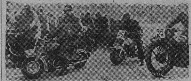
Las motos preparadas para las salidas, que se dieron con intervalos de dos minutos

De poco, de muy poco serviría hablar del éxito de la primera prueba oficial del Moto Club de España si junto a su valor técnico no encontrásemos la popularidad y la adhesión de los aficionados.