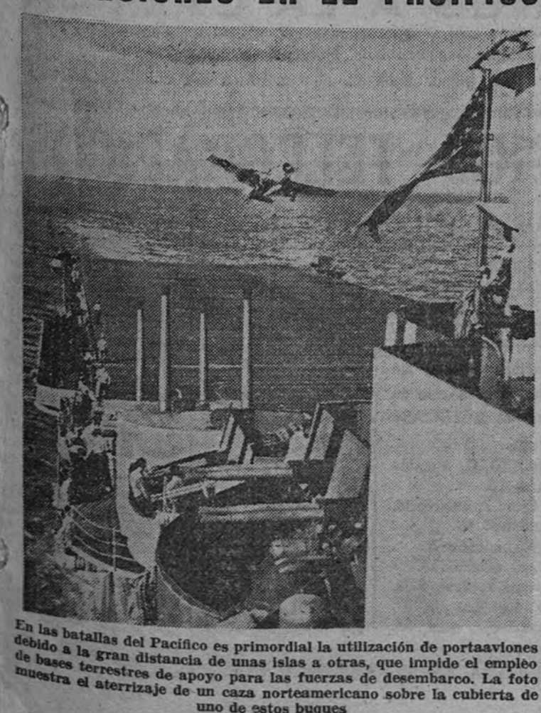
En las batallas del Pacífico es primordial la utilización de portaaviones debido a la gran distancia de unas islas a otras, que impide el empleo de bases terrestres de apoyo para las fuerzas de desembarco. La foto muestra el aterrizaje de un caza norteamericano sobre la cubierta de uno de estos buques