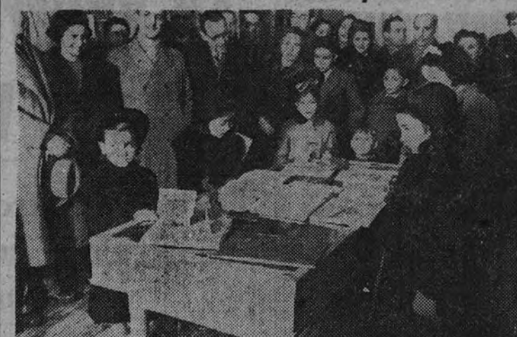
Un aspecto del interesante desfile de pequeños, acompañados de sus familiares, por las dependencias de la Exposición del Libro Infantil