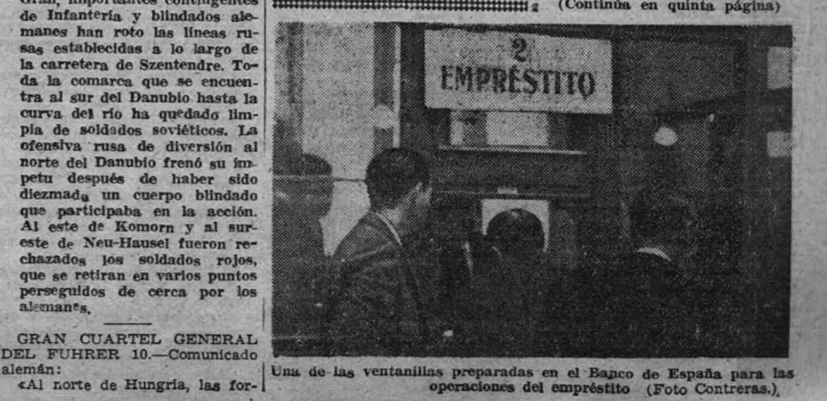
Una de las ventanillas preparadas en el Banco de España para las operaciones del empréstito.