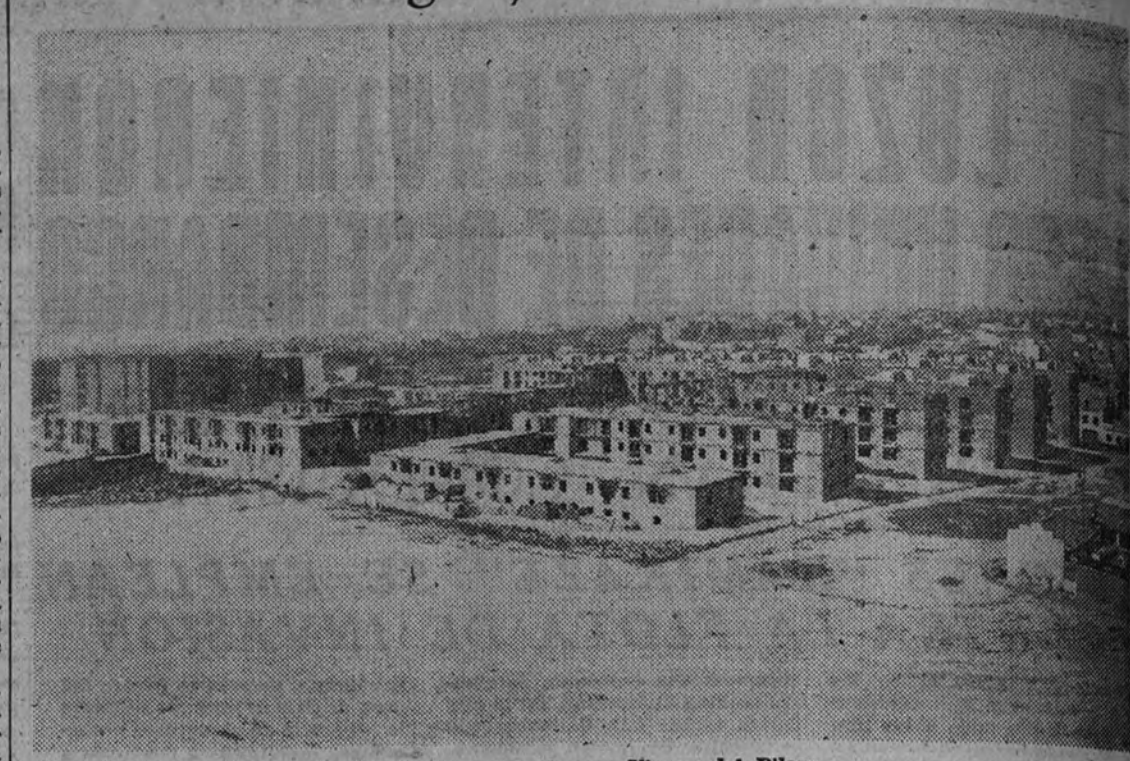
Perspectiva del bloque «Virgen del Pilar»

Está compuesto por 1.200 viviendas y podrá albergar 7.000 personas