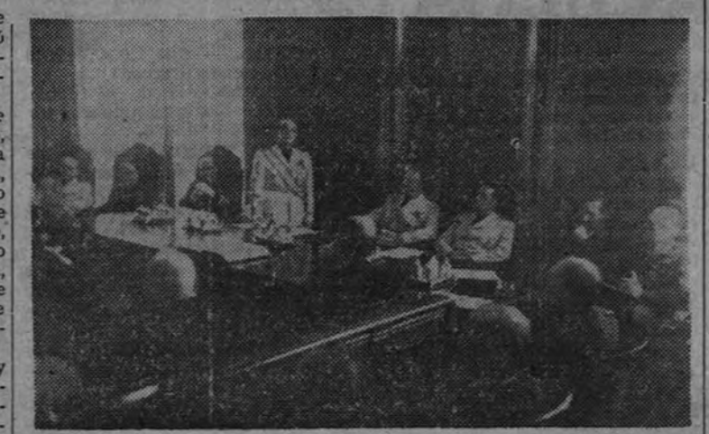
El nuevo Presidente pronuncia su discurso ante el Gobierno y personalidades que asistieron al acto.