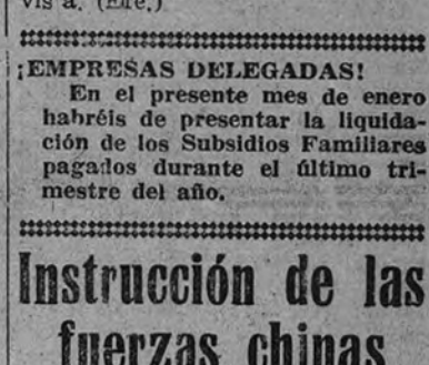
Instructores norteamericanos muestran a los soldados chinos la forma de luchar sin armas contra un enemigo armado (Foto Pando.)

Instrucción de las fuerzas chinas Instructores norteamericanos muestran a los soldados chinos la forma de luchar sin armas contra un enemigo armado (Foto Pando.)