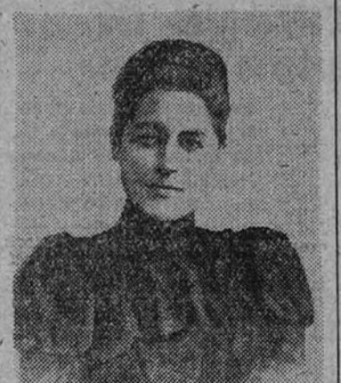
Doña Berta de Rohan en la época de su matrimonio

VIENA 13.—La duquesa de Madrid, doña Berta de Rohan, ha fallecido a los ochenta y cinco años de edad. Contrajo matrimonio con don Carlos de Borbón en el año 1894. Después de residir durante muchos años en Venecia, trasladó su residencia a la capital de Austria, donde ha muerto. (Efe.)