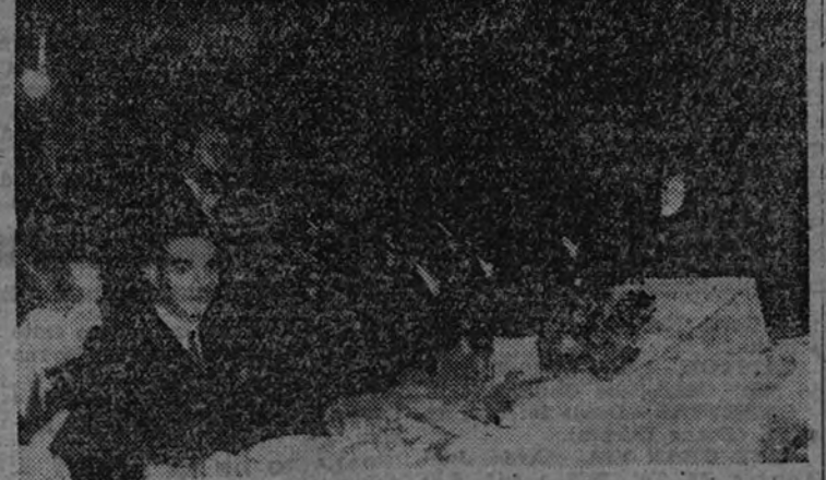
La presidencia del acto

Ofreció el agasajo nuestro camarada Ibáñez Martín