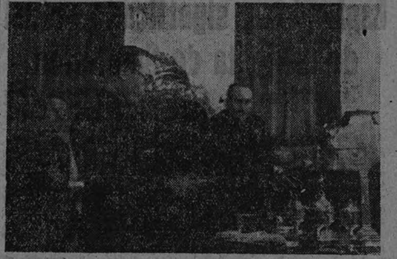
El Delegado Nacional de Sindicatos dando lectura a su discurso en el III Consejo Sindical, bajo la presidencia del Ministro Secretario General del Movimiento

La Ponencia de "Crédito y Política Financiera" ha plasmado en la sesión de ayer, en unas breves discusiones, su labor, larga a través de los meses, copiosa a través de sus trabajos, de sus discusiones, de su constante observación del complejo financiero mundial, que en estos meses ha comenzado a agitarse con vistas a los problemas monetarios y de crédito de la paz en estudios y conferencias de ámbito internacional.