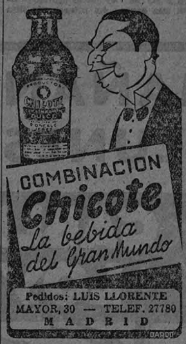
COMBINACION Chicote La bebida del Gran Mundo