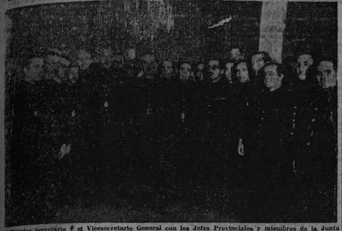
El Ministro Secretario y el Vicesecretario General con los Jefes Provinciales y miembros de la Junta Consultiva, que ayer visitaron al camarada Arrese para testimoniarle su adhesión al Caudillo y su gratitud por las recientes disposiciones en beneficio del Magisterio. Presidia a los camaradas del S. E. M. el jefe Central del Servicio. (Información en cuarta página.)