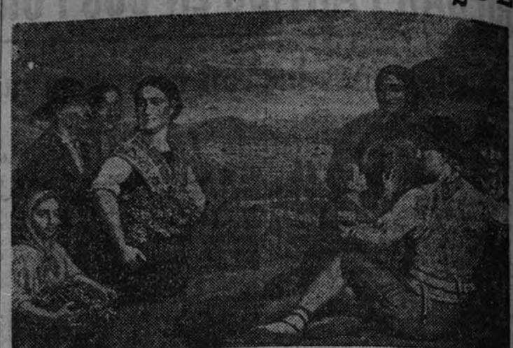
«Vendímlas», por Angel Larroque

Uno de los aspectos más salientes del conjunto presentado por Angel Larroque en los salones de la Casa Macarrón es la importancia concedida al motivo pictórico. Aunque el interés por el cuadro de amplia composición se resuelve en este caso sobre ciertos esquemas de la pintura española del siglo XIX, no deja de tener una especial significación en este momento, en el que el arte ha reducido considerablemente el alcance del tema. La transposición romántica alcanza toda la obra del artista, incluso los retratos. En los cuadros de marinos y de campesinos el pintor evoca el naturalismo costumbrista del siglo pasado, tanto en el ritmo y carácter de las escenas como en el procedimiento pictórico. Volvemos a encontrar en estas obras, junto a la fidelidad descriptiva, esa naturalidad en la composición, y encanto apacible de las obras del mismo género de Valeriano Bécquer; sin la precisión de contornos, naturalmente, que impone en la pintura ochocentista el estilo lineal.