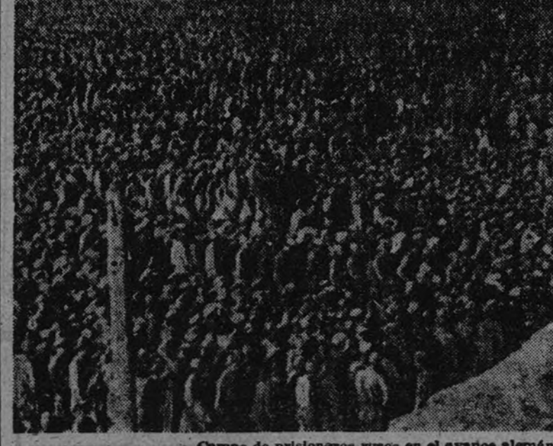
Campos de prisioneros rusos en el avance alemán de 1941

Por dos o tres veces hemos insistido sobre la cifra de prisioneros alemanes capturados por los rusos durante los diez primeros días del asalto soviético. Es modesta. No guarda proporción con las maniobras desplegadas y con los territorios invadidos. Hay en ello algún secreto que, por el momento, no podemos descifrar. Leíamos hoy una noticia oficial difundida desde el Cuartel General de Montgomery, y en ella encontramos otro dato que acrecienta nuestras dudas y subraya ciertas sospechas. «Desde el comienzo de la ofensiva británica en el Roer—dice el despacho—, o sea en diez días, hemos hecho a los alemanes 2.450 prisioneros, número que equivale, según se cree aquí, a la mitad de los infantes germanos que guarnecían el sector al iniciarse el ataque». De lo cual se desprende que en los combates del Roer, tenaces, duros, sangrientos, forcejean-