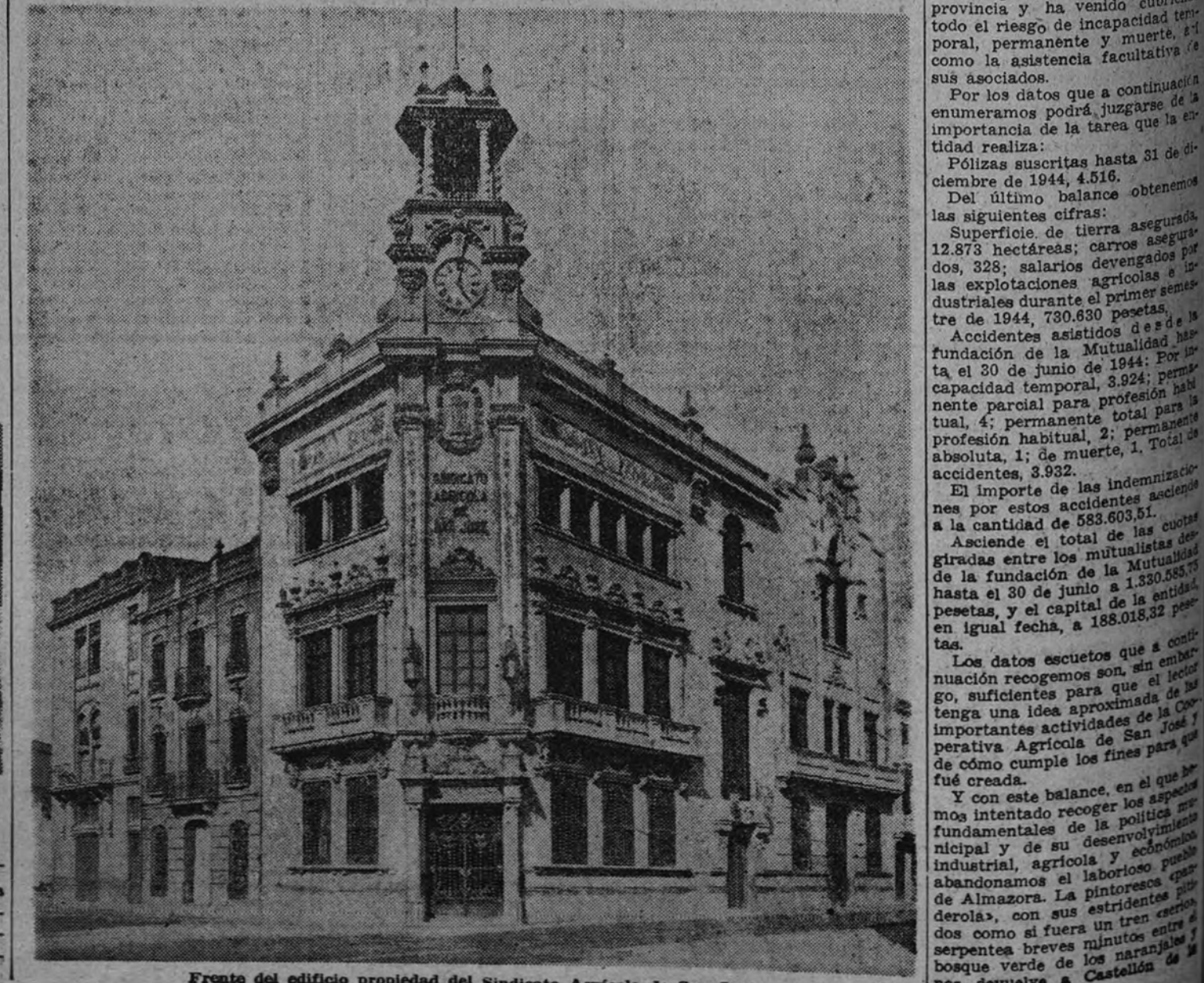
Fronte del edificio propiedad del Sindicato Agrícola de San José