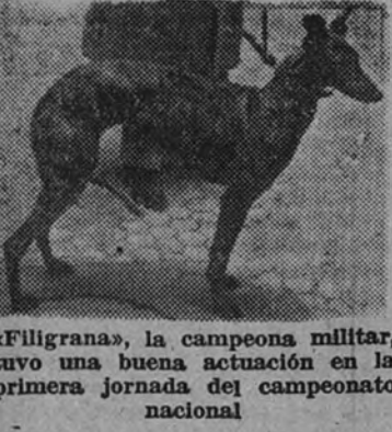
"Filigrana", la campeona militar, tuvo una buena actuación en la primera jornada del campeonato nacional

"Filigrana" gana a "Bandera", "Pilot" empató con "Torrijeta".