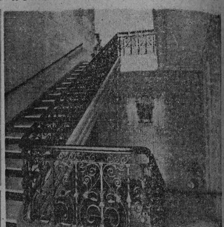
Magnífica escalera que da acceso a las oficinas y servicios de las plantas superiores en el Sindicato Agrícola de San José

Han sido elevadas a seis el número de camas del Hospital, en vez de dos que existían antes, y el trato que los acogidos a este centro benéfico reciben no puede ser mejor. Ha sido restaurada en su totalidad la iglesia parroquial, en la que hemos tenido que lamentar la pérdida de un altar barroco, y hemos erigido un monumento a los Caídos. Asimismo se ha reconstruido el puente de seis ojos que,