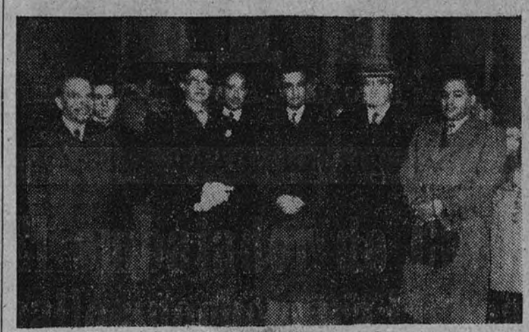
El señor Figueroa Anguita, con el Cuerpo diplomático, momentos antes de iniciar su viaje

EL SEÑOR FIGUEROA ANGUIITA FUE DESPEDIDO EN LA ESTACION POR TODO EL CUERPO DIPLOMATICO ACREDITADO EN MADRID