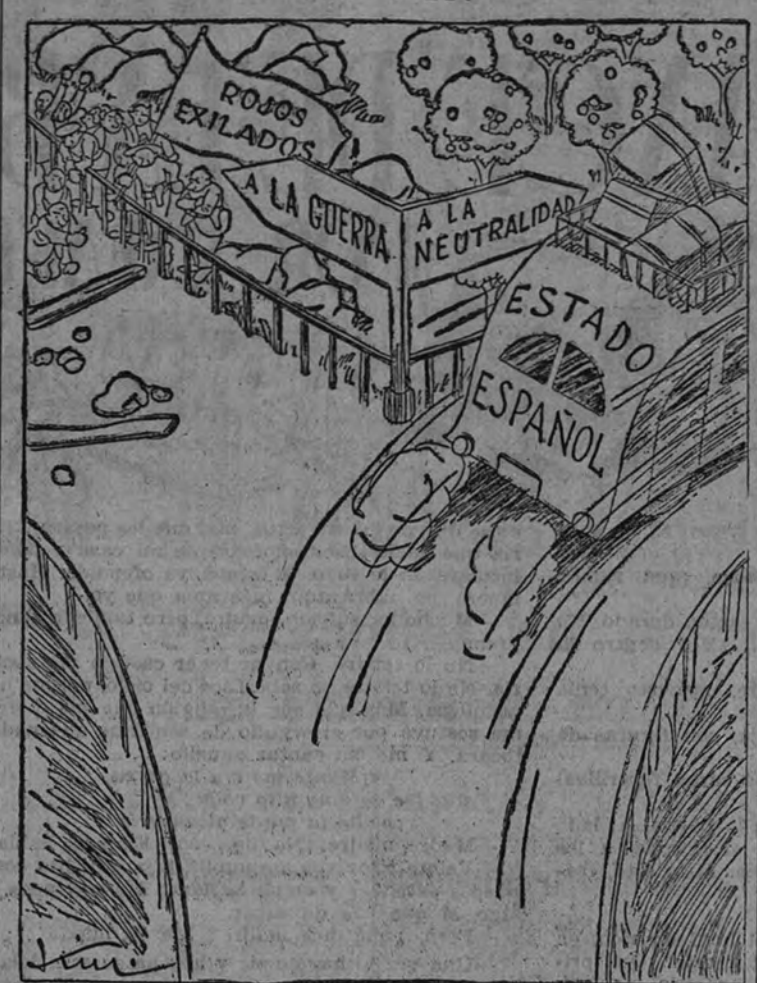
—¡Compañeros, hemos perdido el autobús!