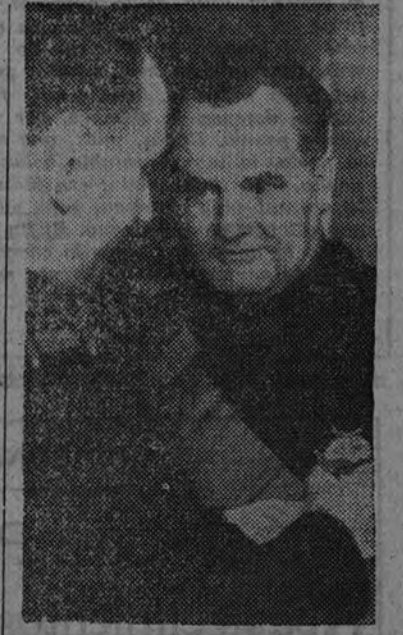
El Ministro Secretario en el momento de la imposición de la Gran Cruz de la Orden de Cisneros al Ministro de Industria y Comercio, camarada Carceller.