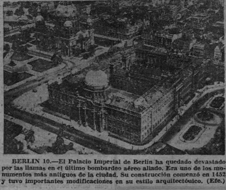
BERLIN 10.—El Palacio Imperial de Berlín ha quedado devastado por las llamas en el último bombardeo aéreo aliado. Era uno de los monumentos más antiguos de la ciudad. Su construcción comenzó en 1452 y tuvo importantes modificaciones en su estilo arquitectónico. (Efe.)