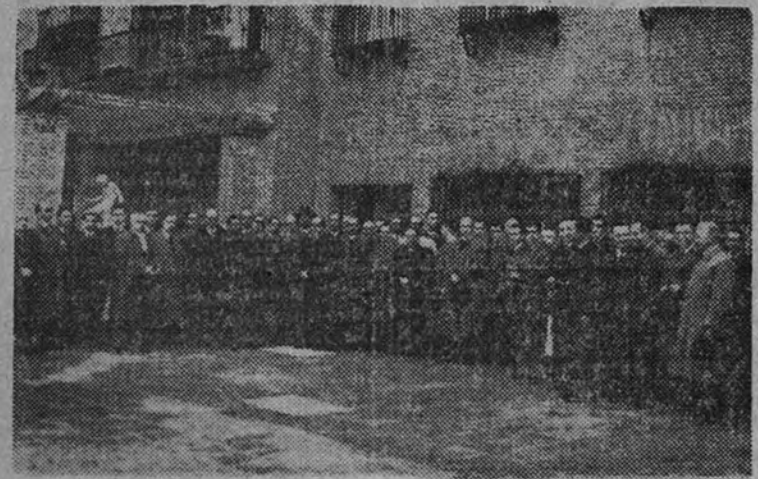
El Subsecretario de Trabajo, camarada Esteban Pérez González, con el comisario general del Instituto Nacional de Previsión, durante la visita que con los Delegados Provinciales de Trabajo realizaron a las dependencias del referido Instituto.

Se informaron de la obra realizada en seguros sociales