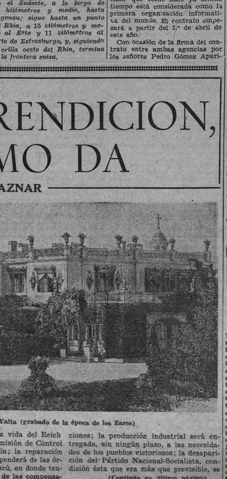
El palacio de Yalta (grabado de la época de los Zares)

Hasta el día de ayer, pocas esperanzas políticas le quedaban a Alemania. Hoy, después de la nota que han publicado Churchill, Roosevelt y Stalin, ya no le queda ninguna. No hay más camino que el de la guerra. La rendición no serviría para nada. «El pueblo alemán—dice categóricamente la declaración oficial de los tres jefes aliados—únicamente hard para sí más penoso el precio de su derrota si intenta continuar su desesperada resistencia.» Lo cual equivale a declarar que, en cuanto a las consecuencias, lo mismo da la capitulación que la guerra, salvo la diferencia de los mayores sufrimientos que consigo trae el seguir combatiendo. Se rindan o dejen de rendirse, capitulen o prolonguen la lucha, los alemanes saben ahora a qué atenerse; para ellos, no hay opción. El programa de los aliados es, en este punto, muy claro: primero, la derrota militar total; después, la ocupación indefinida del territorio germánico, el cual carecerá de Gobierno propio, y será repartido en cuatro zonas de intervención extranjera: la rusa, la norteamericana, la británica y la francesa; toda la vida del Reich quedará sujeta a una Comisión de Control que mandará desde Berlín; la reparación de los daños causados, dependerá de las órdenes que emanen de Moscú, en donde tendrá su asiento el Comité de las compensaciones.