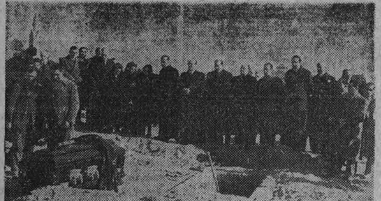
Los Ministros de Educación Nacional y de la Gobernación, con el Subsecretario de Educación y otras personalidades, asisten a la inhumación del cadáver en el Cementerio de la Almudena.

Asistieron los Ministros de Educación Nacional y Gobernación y numerosa representación de todas las Universidades