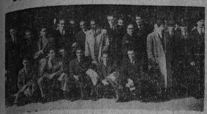
Los jugadores que componen la selección de Lisboa, a poco de llegar a Madrid, donde jugarán con los castellanos

Los jugadores portugueses después de visitar el Ayuntamiento se entrenarán en Chamartín