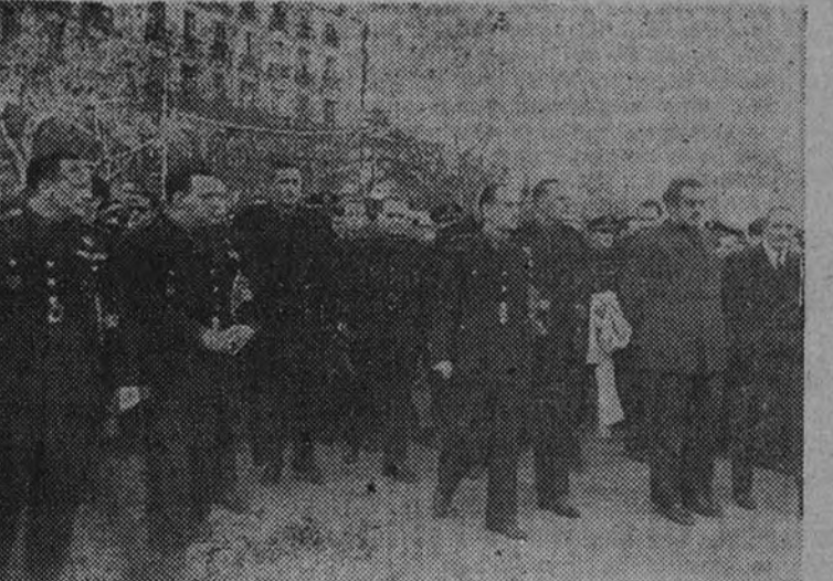
El Gobierno en pleno con la presidencia del duelo

meras horas de la tarde se vieron aumentadas al poco tiempo con otras muchas dedicadas por personalidades y organismos. Figuraban entre ellas las de los Ministros Secretario General del Movimiento y de Trabajo, Diputación Provincial y Ayuntamiento de Madrid, Delegación Provincial de ex Combatientes, Sindicato de la Piel, Comisaría General de Abastecimientos y Transportes, Sindicato Provincial de Ganadería, Delegación Nacional de Sindicatos, Delegación Nacional de Deportes, Instituto Social de la Marina, Sindicato Nacional de Hostelería y otras muchas, que harían interminable la relación. El Ministro Secretario coloca sobre los féretros la Palma Roja A las cinco en punto de la tarde llegó al edificio de la Jefatura Provincial el Ministro Secretario General del Movimiento, camarada Arrese. Ya se encontraban allí otras numerosas jerarquías y personalidades. En la capilla ardiente se verificó el emocionante acto de la imposición por el Ministro de las insignias de la Palma Roja sobre las banderas de la Falange que cubrían los féretros. Acompañaban al Ministro Secretario el Ministro de la Gobernación, camarada Blas Pérez; el de