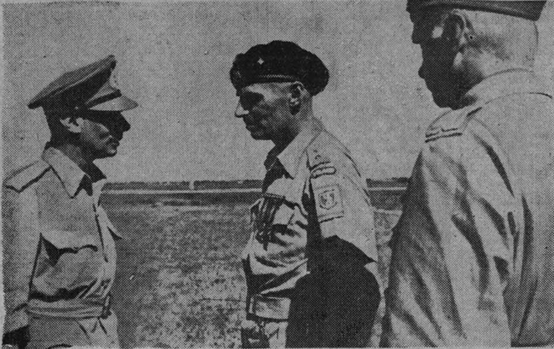
Wladyslaw Anders (en el centro) conversa con Jorge VI en el frente de Italia

No hay dos sin tres. Si veis el número 2 de "SIEMBRA", pedírela el 3 y... los siguientes