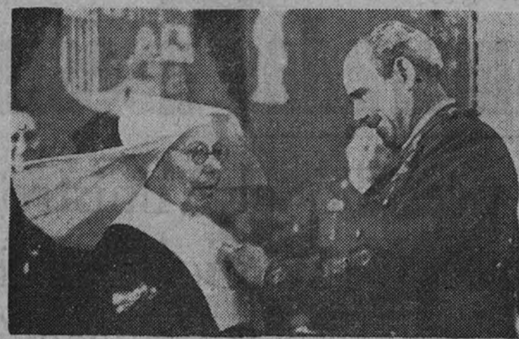
El Ministro del Ejército impone la Cruz del Mérito Militar a la superiora del Hospital Militar de Carabanchel

También condecoró a una hermana de la Caridad que lleva cincuenta años en los hospitales militares