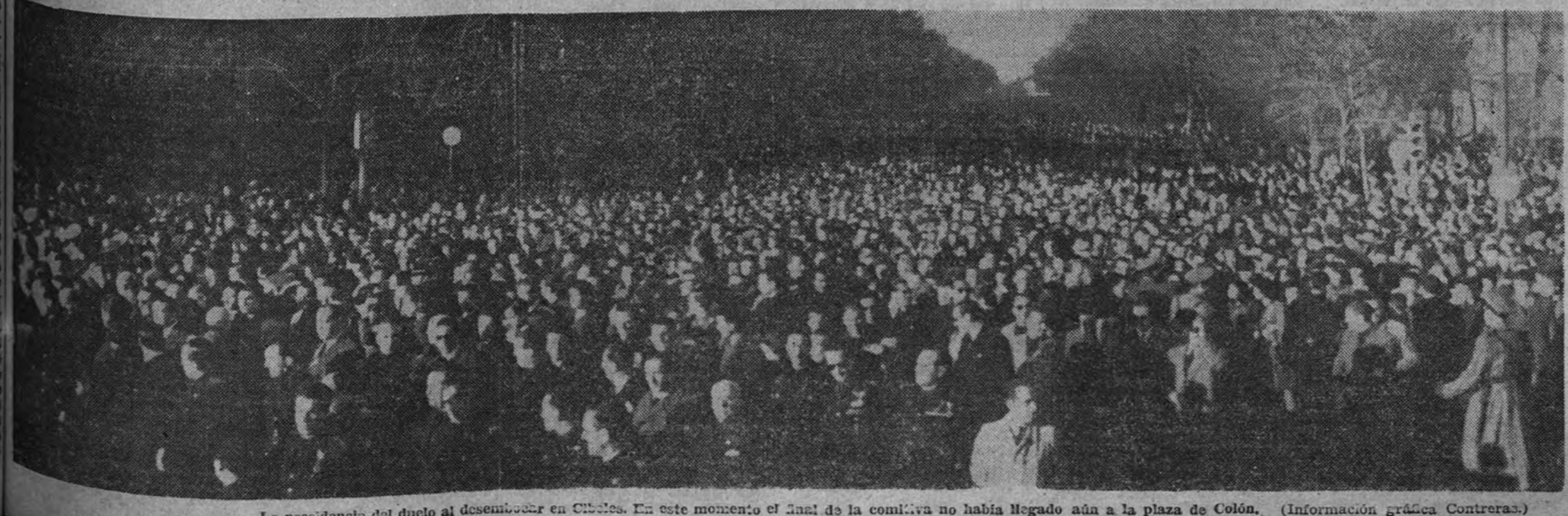
La presidencia del duelo al desfilarse en Cibeles. En este momento el final de la comitiva no había llegado aún a la plaza de Colón.

El pueblo de Madrid ha dado la réplica conveniente a lo que ayer calificábamos de alabonazo para las conciencias dormidas. Contra todo y contra todos España está resuelta a garantizarse su propia paz y el alto rango para su vida de pueblo sólidamente constituido. La rápida y automática, espontánea movilización civil de ayer tarde dice bastante acerca de la situación y de la voluntad de España. Con el murmullo innumerable del cortejo que seguía a los dos últimos caídos falangistas se ha inaugurado una etapa política que la Falange, a las órdenes del Caudillo, sabrá consumir día por día.