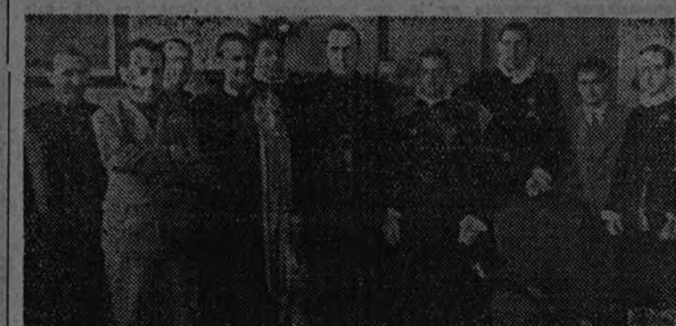
El Vicesecretario recibe a las Tunas Universitarias

La del Distrito madrileño dió un concierto anoche en la Redacción de ARRIBA