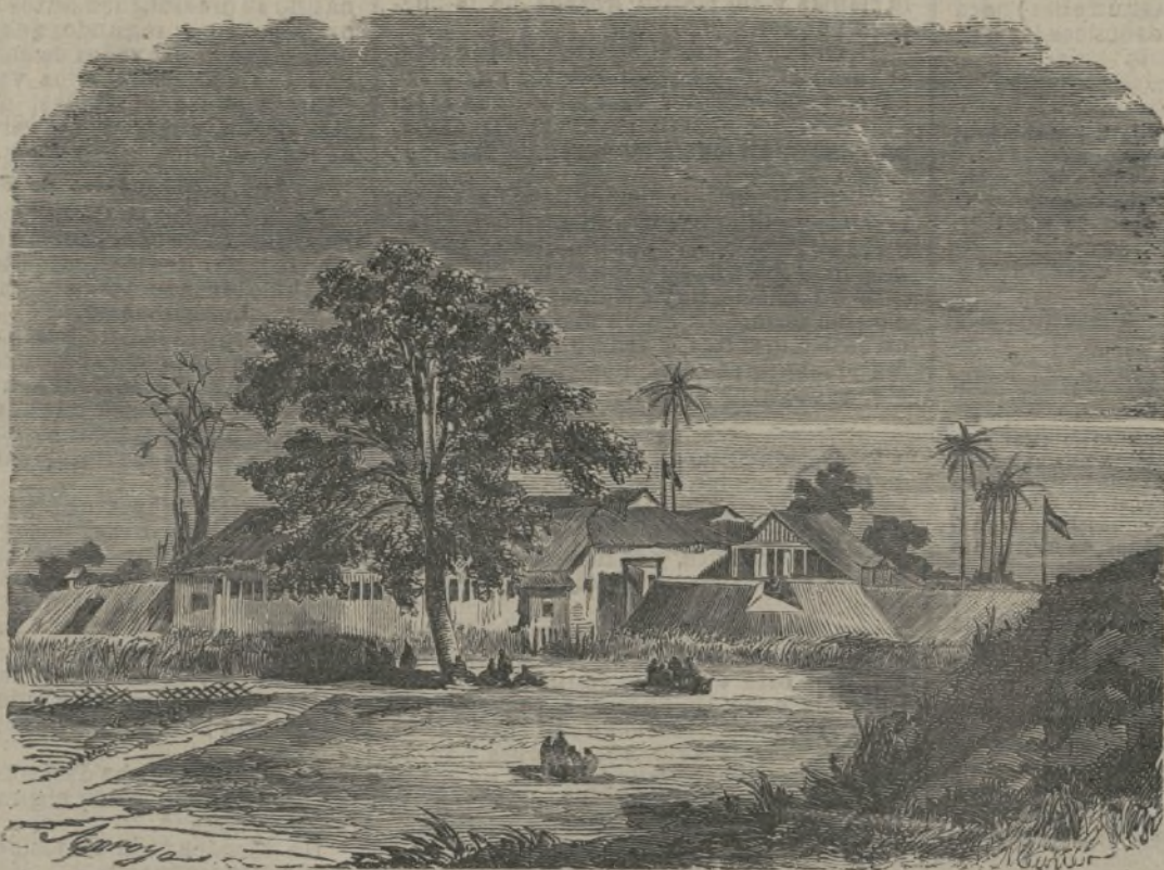
Puerto fortificado en Fernando Pó.

probar personalmente el fundamento de mi juicio.