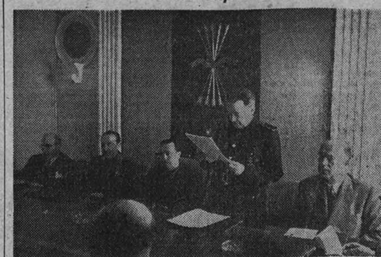
El Delegado Nacional de Sindicatos da posesión a la Junta del Azúcar

En su primera reunión estudió el sistema de la distribución de cupos de remolacha