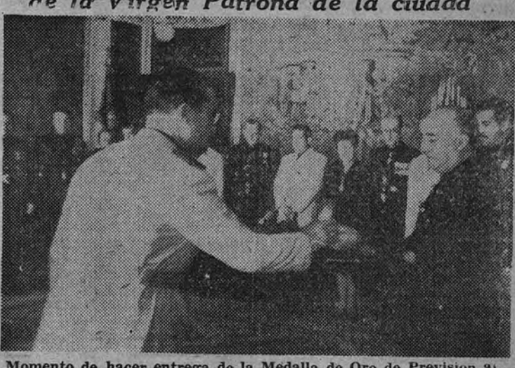
Momento de hacer entrega de la Medalla de Oro de Previsión al Caudillo