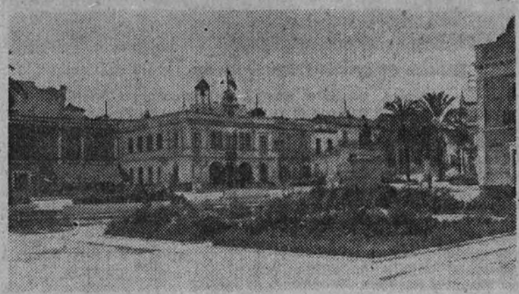
La típica y bella plaza de España, con el edificio del Ayuntamiento al fondo

Hemos dicho que en este aspecto Lebrija se agremia a la primera población de la provincia y vamos a dar la prueba de ello.