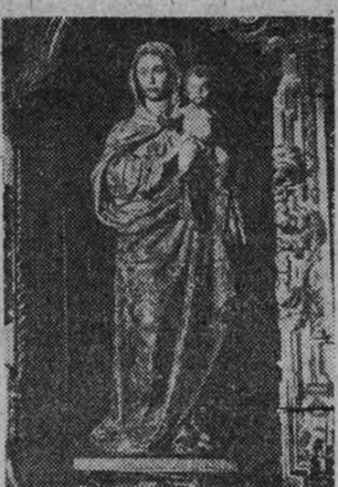
Imagen de la Virgen de la Oliva, de gran veneración popular, obra de Alonso Cano

—Sabíamos, al aceptar ese cargo, la enorme responsabilidad que contraíamos y estábamos convencidos de que para que nuestra gestión fuese eficaz tenía que basarse fundamentalmente en una austeridad en la administración del caudal que se nos confiaba que debíamos imponernos a todo trance. Reducido en verdad era el primer presupuesto que el año 38 confeccionamos. No excedía de 500.000 pesetas. Pero Lebrija precisaba de obras urgentes; había que resolver el problema del abastecimiento de aguas; ha-