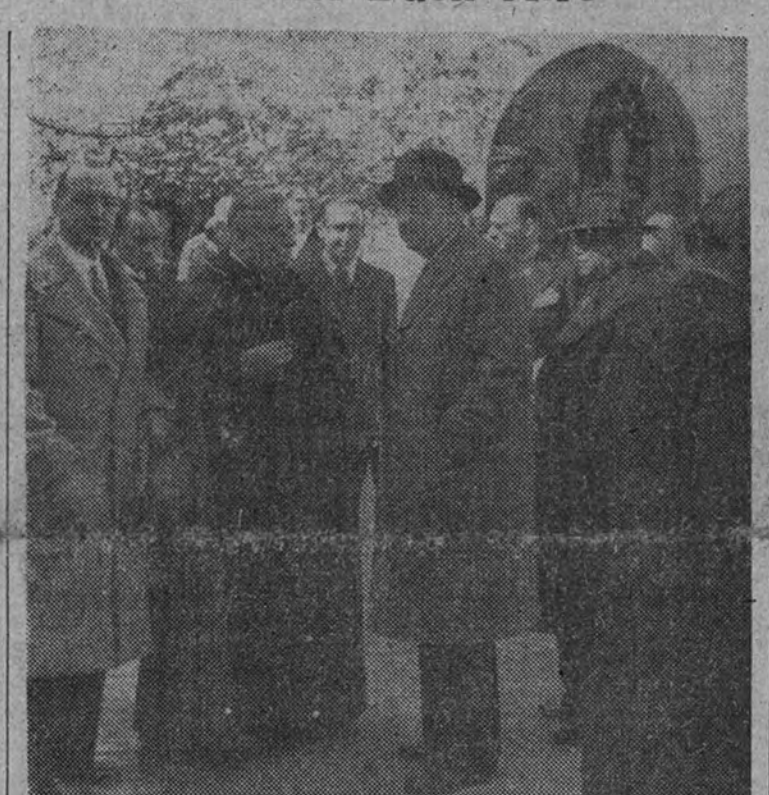
El Ministro de Asuntos Exteriores, señor Lequerica, con el Nuncio de Su Santidad, monseñor Cioognani, y los diplomáticos que realizan la visita a los lugares colimbos, en el patio del convento de Santa Clara, en Palos de Moguer.