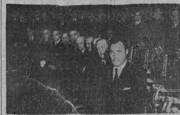
Los Ministros de Agricultura, Justicia y Obras Públicas, con el Presidente de las Cortes y otras personalidades, presiden los funerales

Asistieron sus familiares, el Presidente de las Cortes y los Ministros de Justicia y Obras Públicas