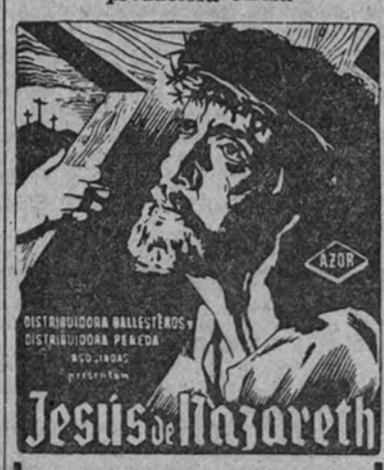
Jesús de Nazareth

PALACIO de la PRENSA CINEMA PALACE HOTEL CINEMA ACTUALIDADES MAÑANA, ESTRENO