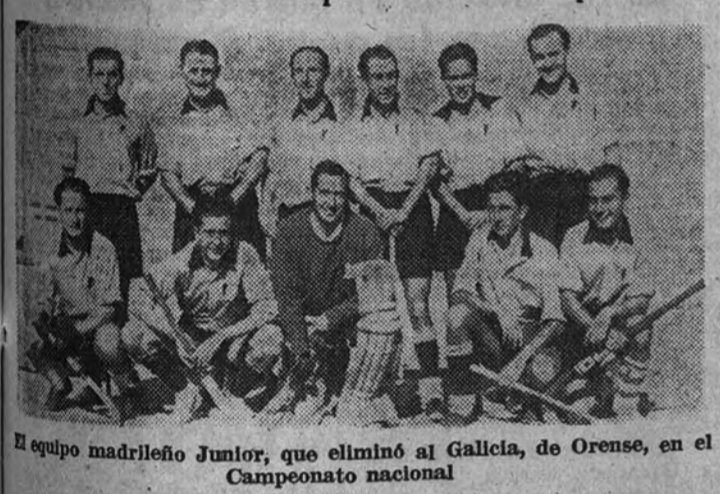
El equipo madrileño Junior, que eliminó al Galicia, de Orense, en el Campeonato nacional

ORENSE.—Se ha jugado el partido entre el Junior de Madrid y el Galicia de Orense, correspondiente al Campeonato de España de hockey.