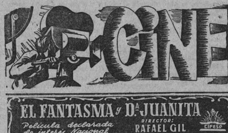
El fantasma y Doña Juanita