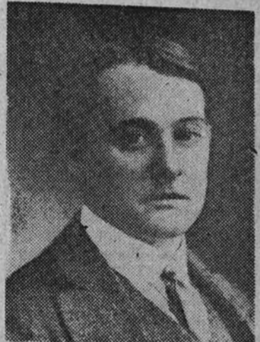
Lord Alfred Douglas a los cuarenta años próximamente

LONDRES 20.—Lord Alfredo Douglas, literato y poeta cuya amistad con Oscar Wilde dió lugar a uno de los escándalos más grandes de la edad de setenta y cuatro años. Era hijo del octavo marqués de Queensberry y figuró en numerosos procesos célebres. En 1915 fue condenado a seis meses de prisión por publicar un folleto ofensivo contra Churchill.