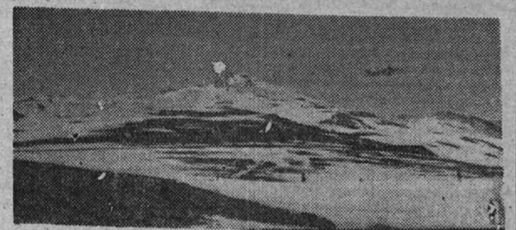
Las pistas de Sierra Nevada, donde se disputarán los próximos Campeonatos nacionales de esquí

Muy pronto se celebrarán en Sierra Nevada los Campeonatos nacionales de esquí. Y nunca mejor ocasión que la que nos brinda el secretario de la Federación Española, para dar una impresión sobre esta interesante competición. —Alguna dificultad? — preguntamos. —En absoluto, todo lo contrario. Este año no habrá necesidad de bajar a la capital durante la celebración del Campeonato. La dificultad que podía haber en esta, y los universitarios han aceptado la amabilidad de cedernos el albergue con todos los servicios a disposición de la Federación Española. —Animación? —Estuve en Granada hace aproximadamente un mes y pude observar el gran entusiasmo y expectación que existe ante la celebración de estos Campeonatos. Todas las autoridades granadinas han prestado su colaboración desinteresada y entusiasta, en especial el Gobernador, señor Fontana. —Son estas pistas las más adecuadas para celebrar un Campeonato nacional? —Lo son, porque además de contar con unas excelentes pistas, la nieve tiene una duración, por lo general, mayor que en cualquier otra región española. —El único inconveniente que tienen estas pistas es el desplazamiento a las mismas. Pero esto quedará solucionado muy pronto con las obras de prolongación del ferrocarril de Sierra Nevada, que se están efectuando actualmente. Además, completará esta serie de comodidades el proyecto de montar un teleférico que, en principio, está ya aprobado.