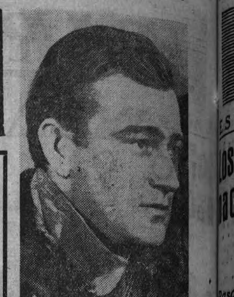
John Wayne comparte con Marlene Dietrich el éxito interpretativo de "Forja de corazones", el gran éxito que en segunda semana se exhibe en el Palacio de la Música