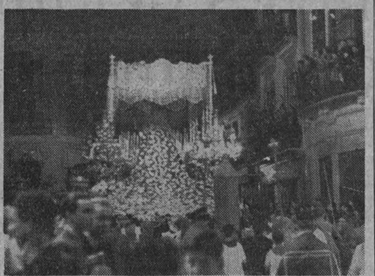
Palio y manto de María Santísima de la Esperanza

Los cofrades malagueños trabajan con todo entusiasmo ante la proximidad de la Semana Santa. Los desfiles procesionales de aquella ciudad han vuelto al antiguo esplendor que les caracterizaba.