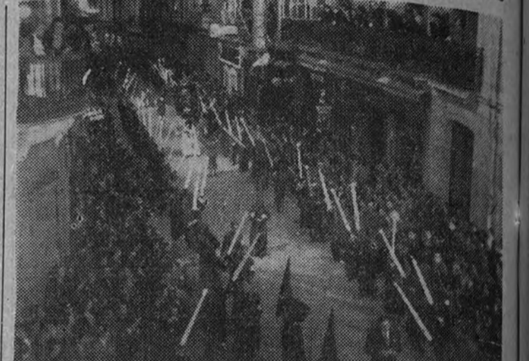
Detalle de un desfile procesional en la Semana Santa malagueña