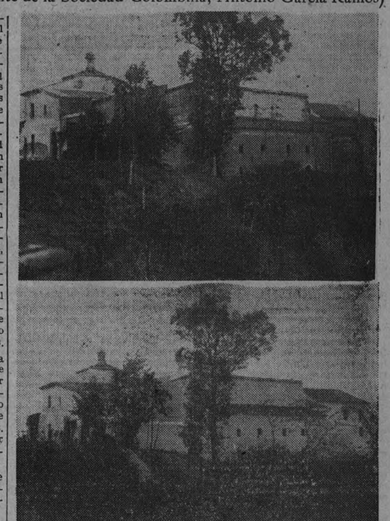
El Monasterio antes y después de su restauración