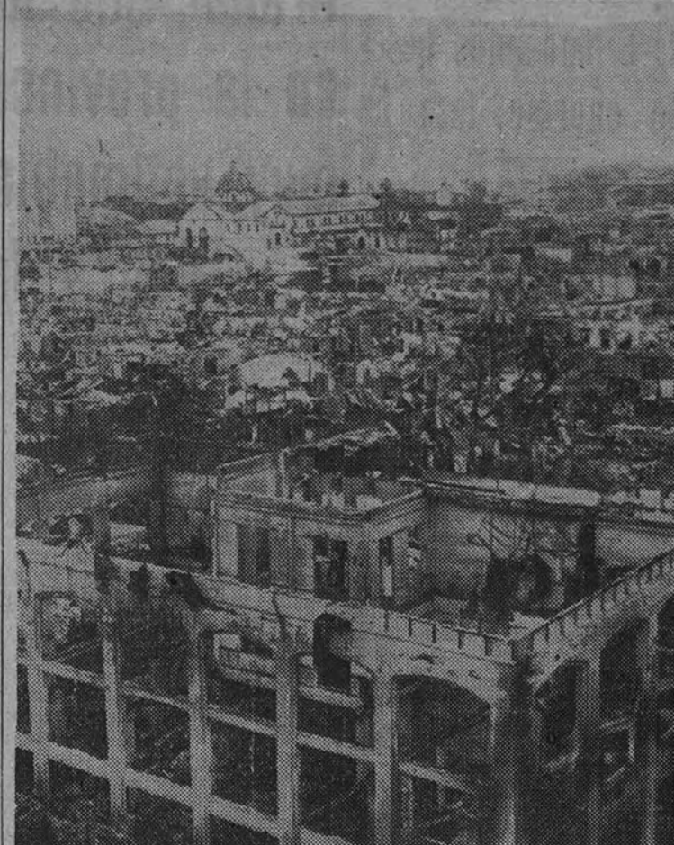
Destrozos producidos por los japoneses en el barrio comercial de Manila