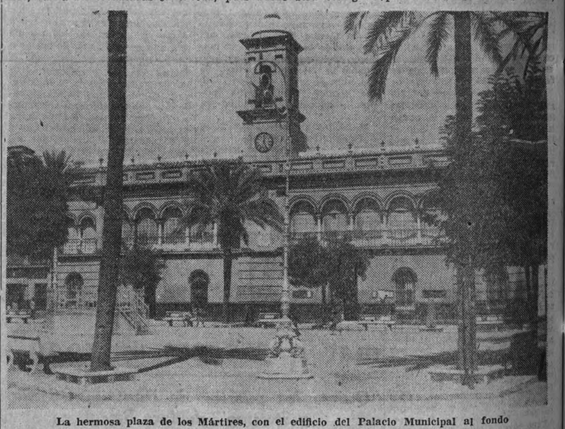
La hermosa plaza de los Mártires, con el edificio del Palacio Municipal al fondo

Adquiridas estas naves, y como hubiéramos oído prodigar elogios al funcionamiento de la Farmacia Municipal, preguntamos sobre su acción benéfica en pro de los pobres, y el señor Oliva me dice: «Estamos, desde luego, satisfechos del desenvolvimiento que el servicio de la Farmacia Municipal ha adquirido y del prestigio que ha alcanzado entre los pobres adscritos a la Beneficencia Municipal, hasta tal punto que aunque pueden libremente acudir a cualquier farmacia de la localidad con la receta que el médico les extienda, y en la que bueno será advertir que tenemos dadas reiteradamente órdenes para que se precepte el despacho de todo medicamento: específicos, sueros, etcétera, que el paciente precise, cualquier que sea su importe, siempre acuden a ésta nuestra, y en proporción tal, que en el transcurso del año último han sido despa-