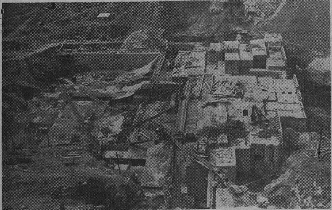
Obras del pantano de «La Minilla» en la provincia de Sevilla

La tercera parte de los regadíos a realizar en diecisiete años están ya en servicio o a punto de inaugurarse