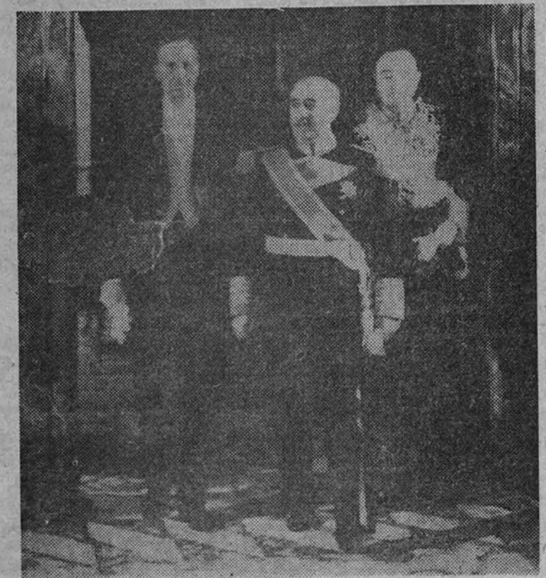
El Caudillo, con el nuevo embajador de Estados Unidos y el Ministro de Asuntos Exteriores, momentos después de la ceremonia.