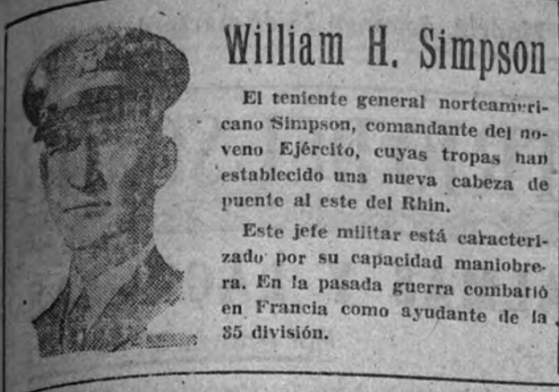
William H. Simpson

El teniente general norteamericano Simpson, comandante del noveno Ejército, cuyas tropas han establecido una nueva cabeza de puente al este del Rin.