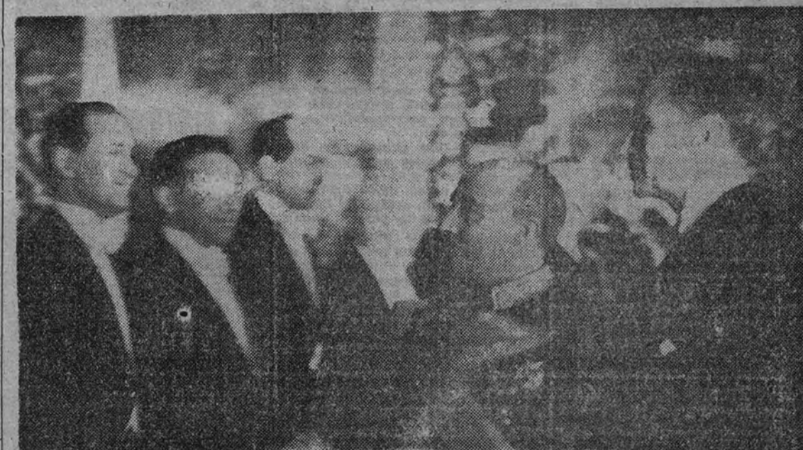
El nuevo embajador presenta al Caudillo los agregados de su Embajada

El Caudillo, Lequerica y Armour conferenciaron durante media hora