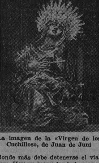
La imagen de la «Virgen de los Cuchillos», de Juan de Juni

donde más debe detenerse el viajero. Hay un lugar donde la mayor prueba está reunida para que la contemplación no se quiebre y para que la continuidad preste al visitante un conjunto de riqueza exquisita; y definitivamente. No sé si está lo suficientemente propagada la existencia del Museo Nacional de Escultura que Valladolid ha merecido, vale la pena de acercarnos a ese lugar que conserva lo que no pudo llevarse la furia desamortizadora. Narciso GARCÍA SANCHEZ