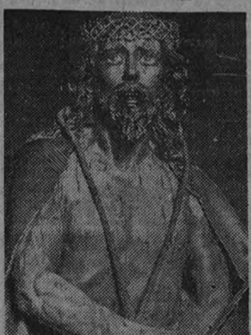
«Cristo de la Caña», al que asiste la Cofradía compuesta por jefes y oficiales de Artillería

Muy ligeramente queda expuesto el sentido, la preparación y el arte de la Semana Santa de Valladolid. Ahora no terminaría este rápido reportaje si hiciera un silencio de la abundancia escultórica que la ciudad castellana posee con grandes merecimientos. Durante los siglos XVI y XVII artistas cuya inmortalidad está bien manifestada trabajan con desvelo desde sus talleres instalados en Valladolid en los años más decisivos de su labor artística. Gregorio Fernández, Juan de Juni, Alonso Berruete, Gaspar de Tordesillas, Esteban Jordán, Pedro de la Cuadra y tantos otros realizaron con prodigiosa plasticidad honra a España, y la Patria conserva escudada por sus iglesias las obras de tan excelsa imaginería. Como es natural, Valladolid se ve significada con la múltiple riqueza de concepción artística de todos ellos, existiendo quizás en cada templo de la ciudad una muestra de tan ejemplar laboriosidad. No es aquí