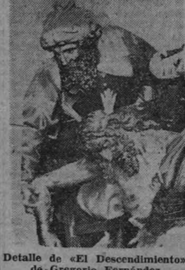
Detalle de «El Descendimiento», de Gregorio Fernández

En los monumentales «pasos» que Valladolid expone por la ciudad en los cortejos de su Semana Santa podemos seleccionar junto a la maestría de Juan de Juni y de Gregorio Fernández—dos valores de la escultura castellana—el contraste de sus estilos. Frente a la suavidad y expresiva delicadeza de este último existe la expresión, un tanto rebelde y declaratoria, de Juan de Juni. En aquel se define pronto la sensibilidad inconformista, y no sólo sentía la emoción general de su tiempo, sino que era capaz de transportarla sin violencias a la madera modelada. Hay, por ejemplo, en la réplica de la «Piedad», en el rostro dolorido de María, una auténtica unión de la Madre que nos espera y se duele con los brazos abiertos al infinito. Juan de Juni es el otro aspecto de la escultura castellana. En él