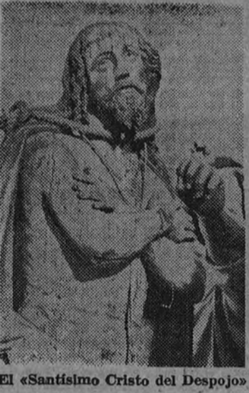
El «Santísimo Cristo del Despojo»

Muy ligeramente queda expuesto el sentido, la preparación y el arte de la Semana Santa de Valladolid. Ahora no terminaría este rápido reportaje si hiciera un silencio de la abundancia escultórica que la ciudad castellana posee con grandes merecimientos. Durante los siglos XVI y XVII artistas cuya inmortalidad está bien manifestada trabajan con desvelo desde sus talleres instalados en Valladolid en los años más decisivos de su labor artística. Gregorio Fernández, Juan de Juni, Alonso Berruete, Gaspar de Tordesillas, Esteban Jordán, Pedro de la Cuadra y tantos otros realizaron con prodigiosa plasticidad honra a España, y la Patria conserva escudada por sus iglesias las obras de tan excelsa imaginería. Como es natural, Valladolid se ve significada con la múltiple riqueza de concepción artística de todos ellos, existiendo quizás en cada templo de la ciudad una muestra de tan ejemplar laboriosidad. No es aquí