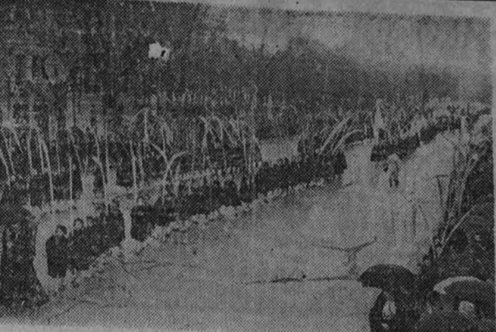
La procesión de las Palmas del Domingo de Ramos, a su paso por las calles de Madrid

COMIENZAN EN PORTUGAL LAS SOLEMNIDADES DE SEMANA SANTA LISBOA 26.—Con gran concurrencia de fieles han comenzado en todos los templos portugueses las solemnidades de Semana Santa. En la sede patriarcal el Primado, cardenal Grejira, presidió la procesión de las palmas. En el templo parroquial del Santo Condestable se celebró la tradicional procesión del Señor de los Pasos, que recorrió diversas calles del distrito.