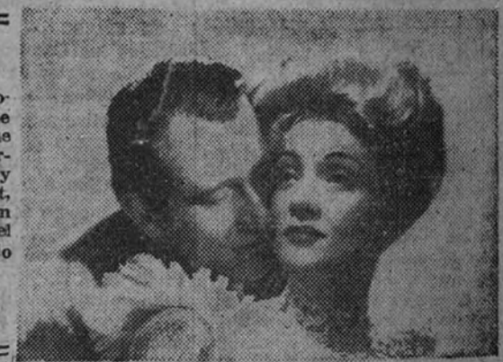
"Los usurpado- res", película de Nueva Films, que interpretan Mar- lene Dietrich y Randolph Scott, mostrará un gran éxito, hoy en el sensacional Palacio de la Prensa