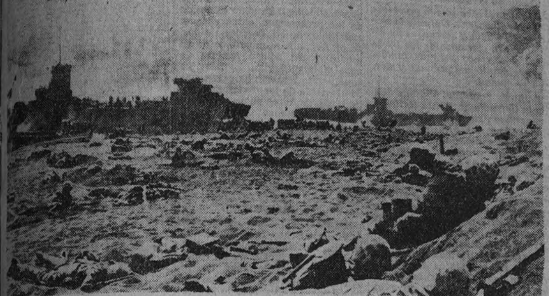
Los soldados norteamericanos inician las operaciones de desembarco en Iwojima. Varias unidades de infantería saltan de las lanchas y barcas de transporte para iniciar la conquista de la isla japonesa.

La flota norteamericana es tres veces mayor que la del Japón Nimitz, jefe de la Flota americana, es el marino más brillante de nuestra época