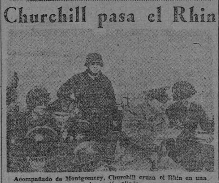
Acompañado de Montgomery, Churchill cruza el Rhin en una embarcación aliada

(En cuarta página, crónica de nuestro correspondiente en Lisboa.)