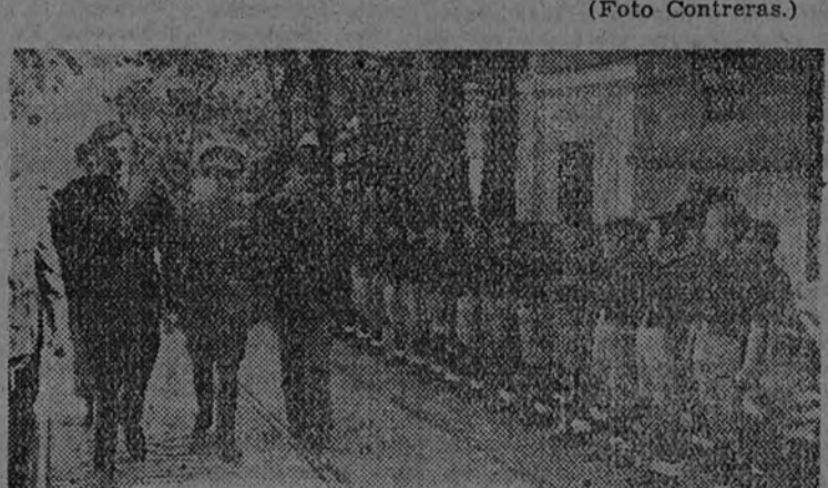
Los jefes de las Mocidades portuguesas, con el Delegado Nacional del Frente de Juventudes, pasan revista a la Centuria de las Falanges juveniles que les rindió honores.